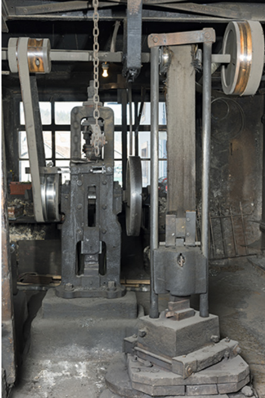
Martinet vertical à ressort (à gauche) et mouton (à droite) : face antérieure. 25, Grand'Combe-Château, 5-9 Pré Rondot