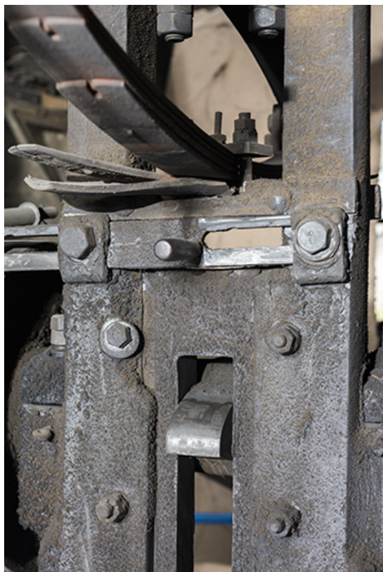
Martinet vertical : la came (avec, au-dessus, la poignée du système d'embrayage et le bas des ressorts). 25, Grand'Combe-Châteleu, 5-9 Pré Rondot