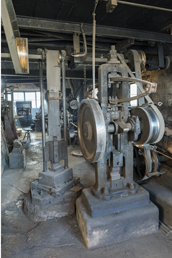
Martinet vertical (à droite) et mouton (à gauche) : face postérieure.