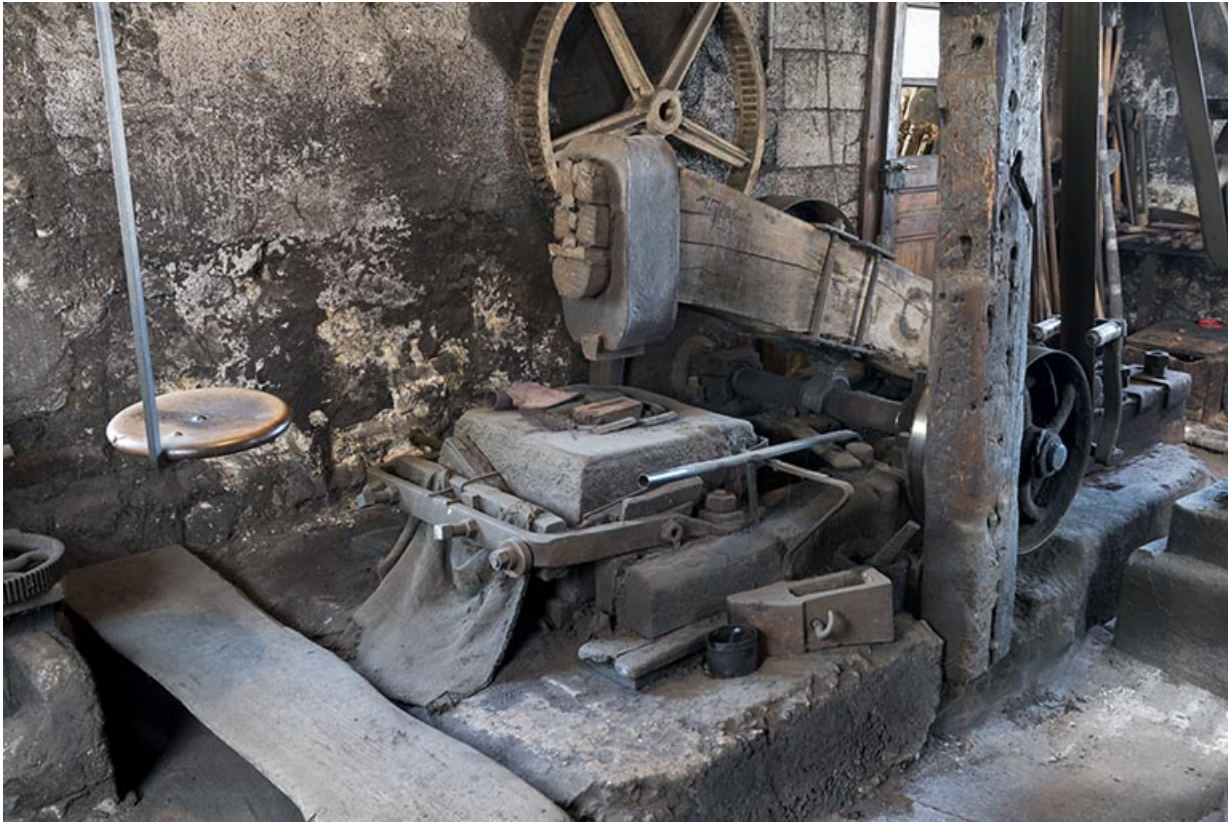
Tête du martinet et poste de travail.