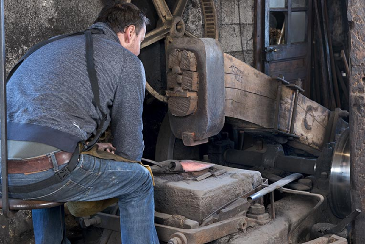
Martinet de l'atelier de taillanderie Vuillemin, à Grand'Combe-Château.