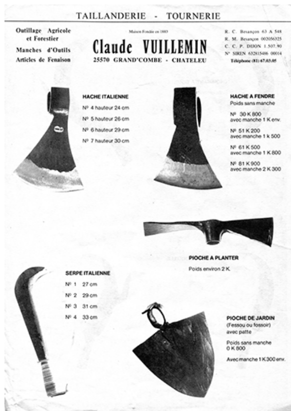
Taillanderie - tournerie Claude Vuillemin [production p. 1 : haches, pioches et serpe], 4e quart 20e siècle. 25, Grand'Combe-Château, 5-9 Pré Rondot