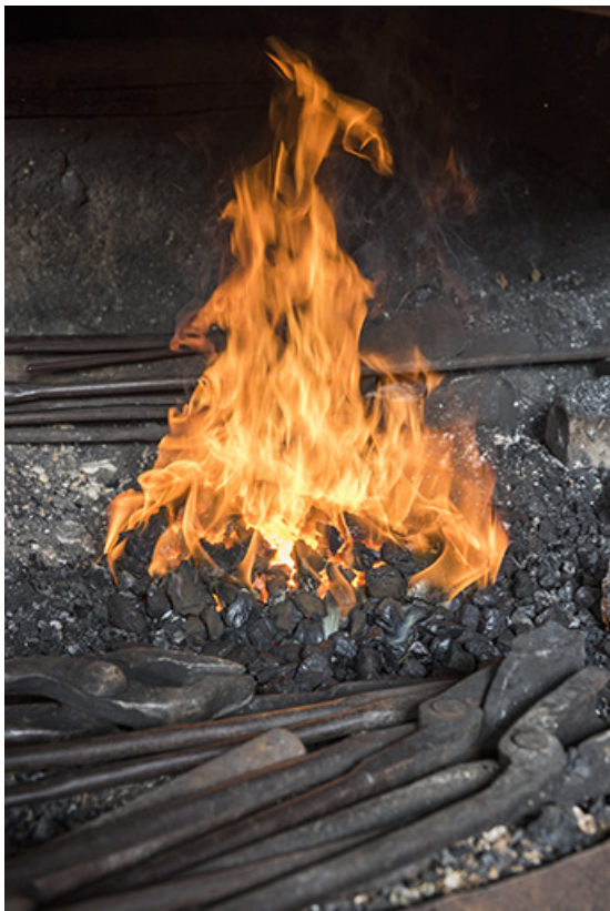
Fournaise simple : le foyer.

25, Grand'Combe-Châteleu, 5-9 Pré Rondot