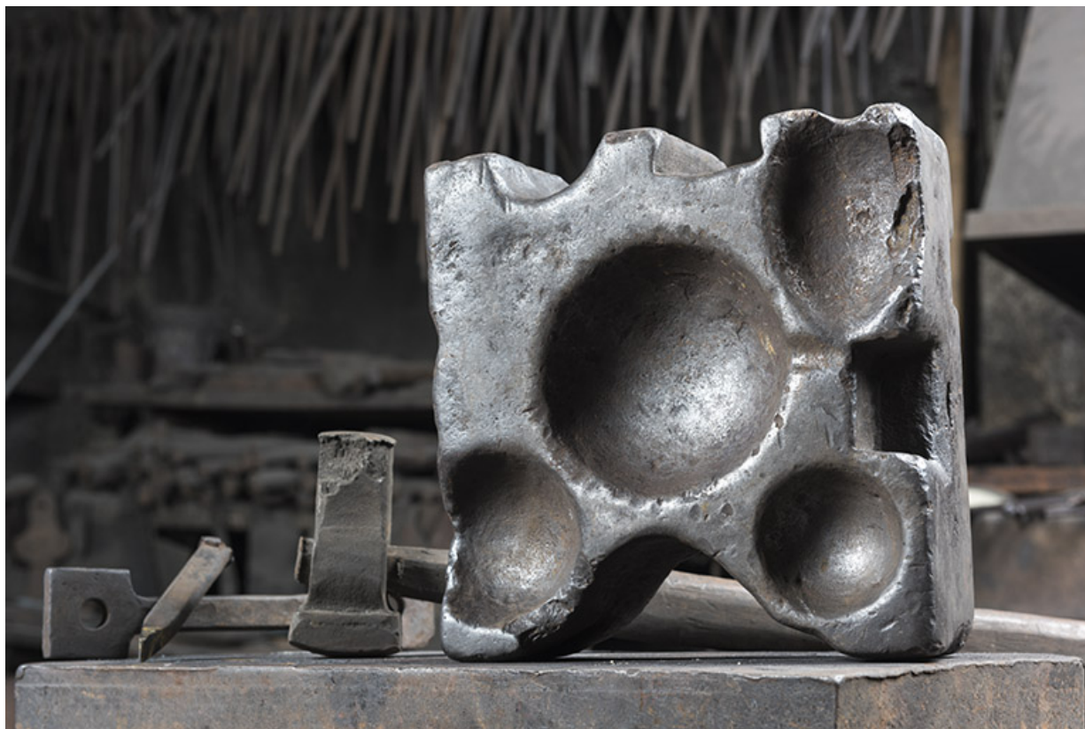
Tas de forgeron et marteaux.

25, Grand'Combe-Châteleu, 5-9 Pré Rondot