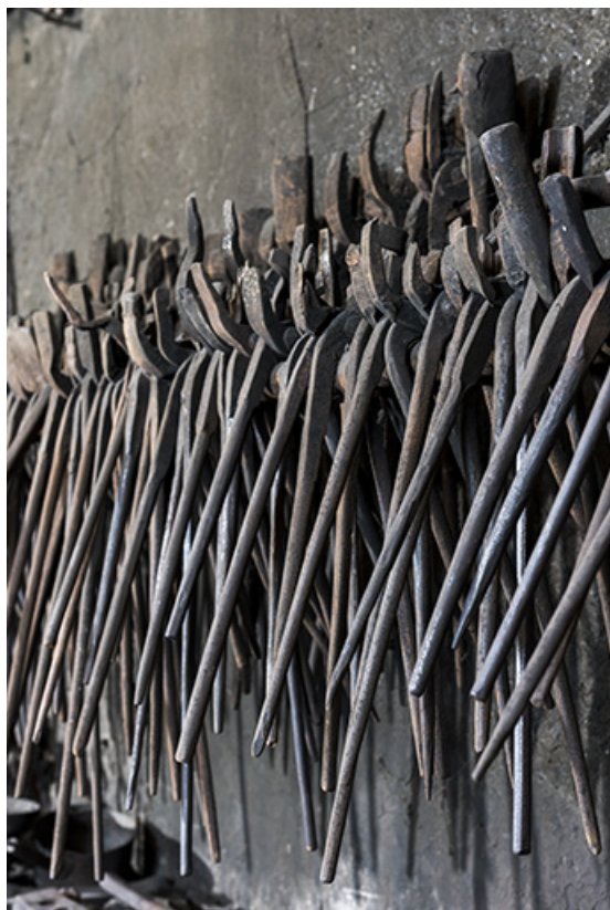
Pinces de forgeron.