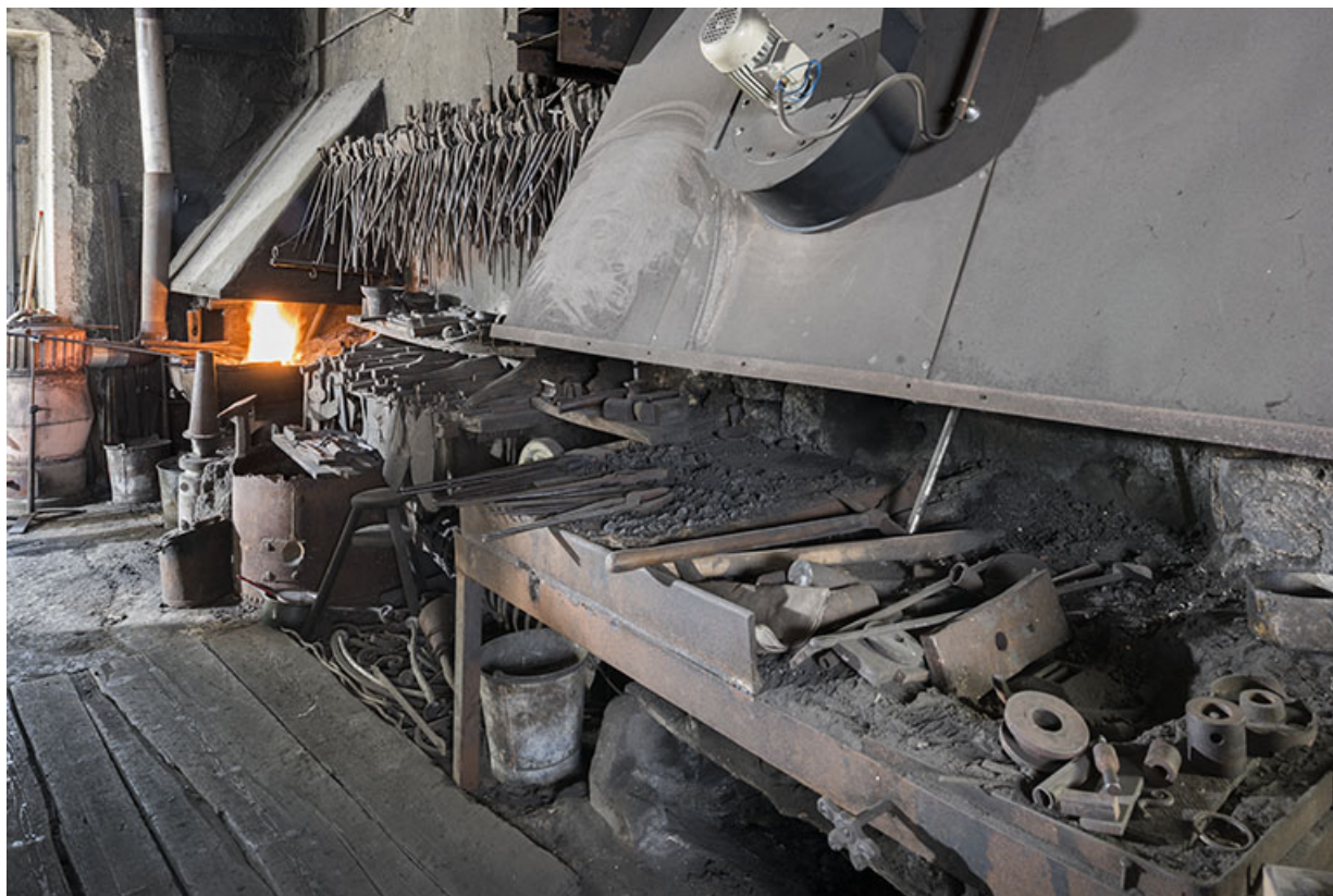
Atelier de travail à chaud : les fournaies.