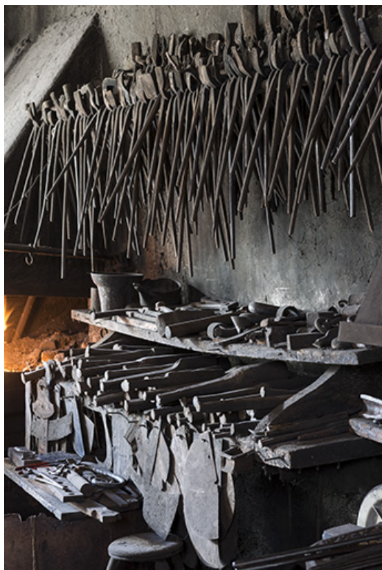
Pinces de forgeron, outils et gabarits.

25, Grand'Combe-Châteleu, 5-9 Pré Rondot