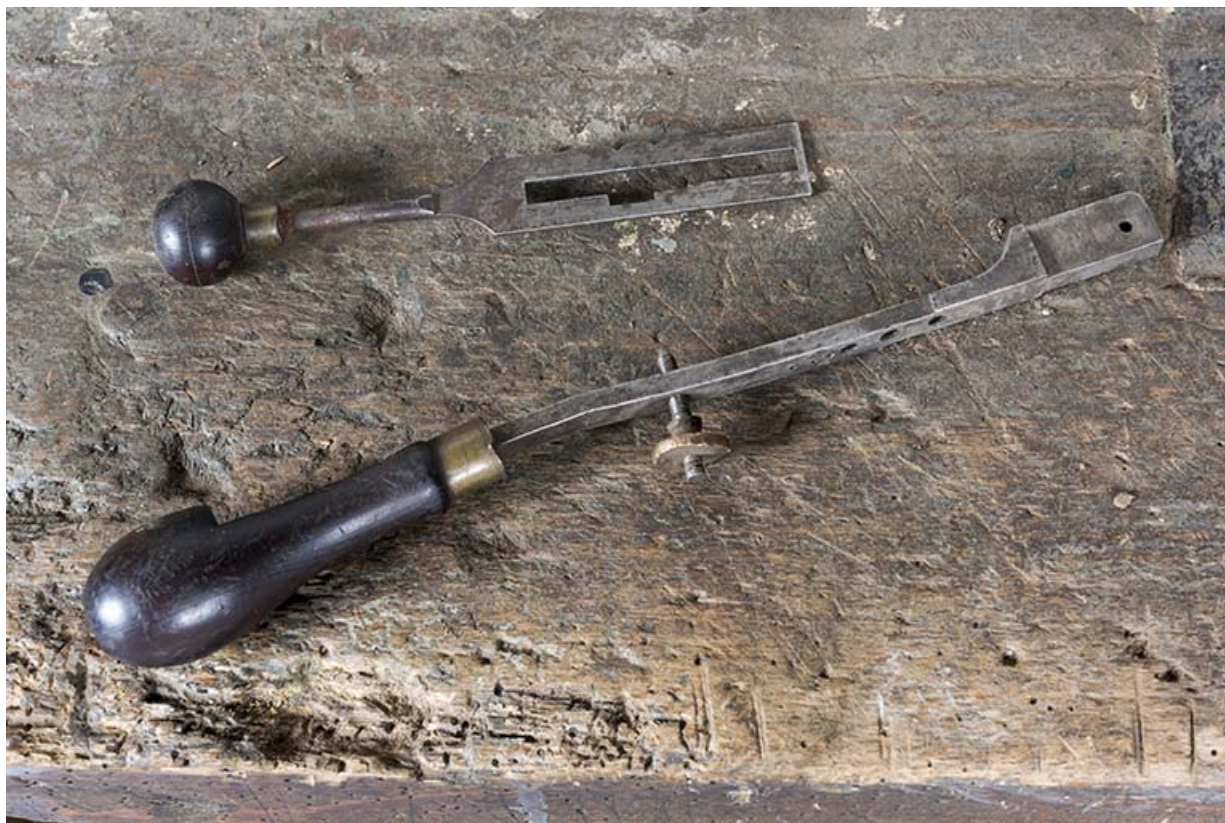
Module de gravage : levier et guide supplémentaires.