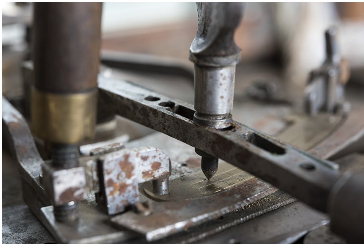
Module de gravage : la pointe à graver. 25, Les Gras