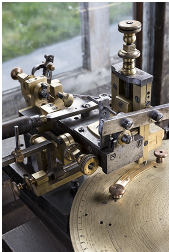
Module de gravage : vue plongeante, de trois quarts gauche. La came réglant la longueur des traits de division est visible à l'arrière-plan.