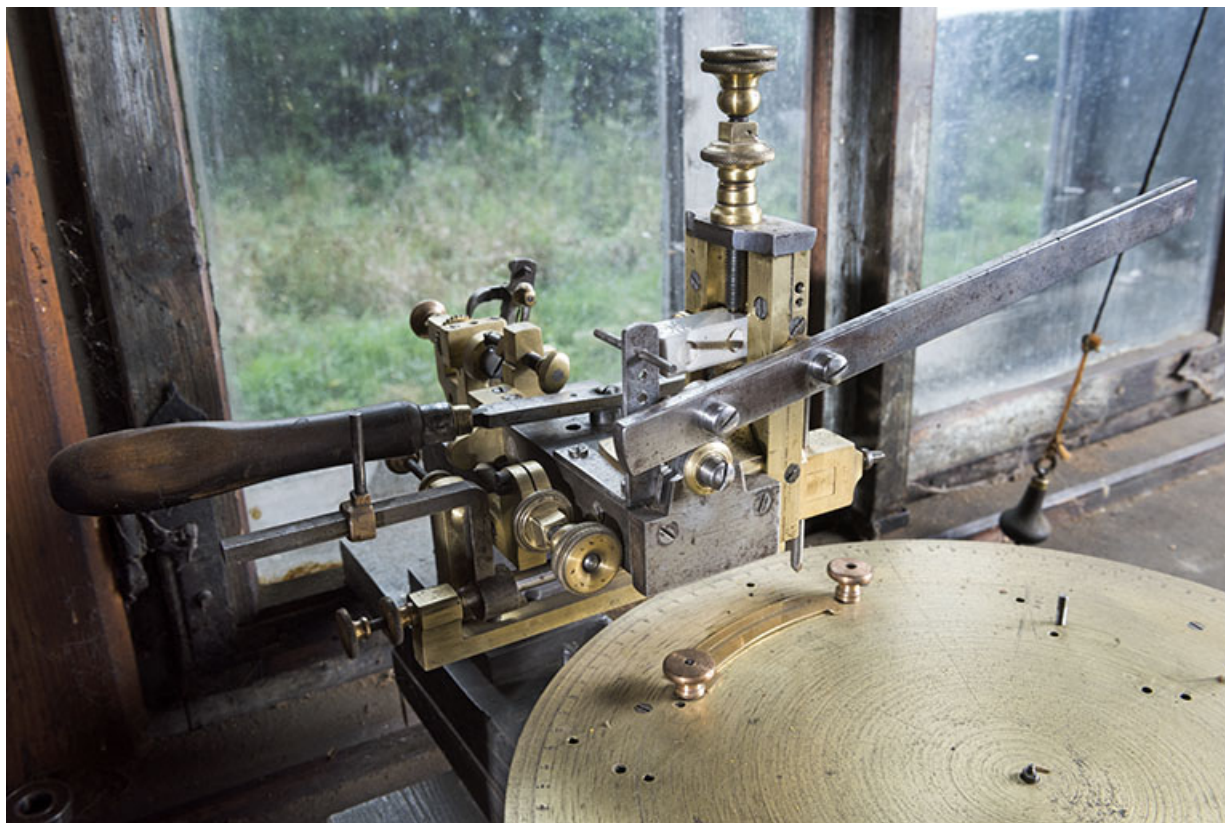
Module de gravage, de trois quarts gauche. 25, Les Gras