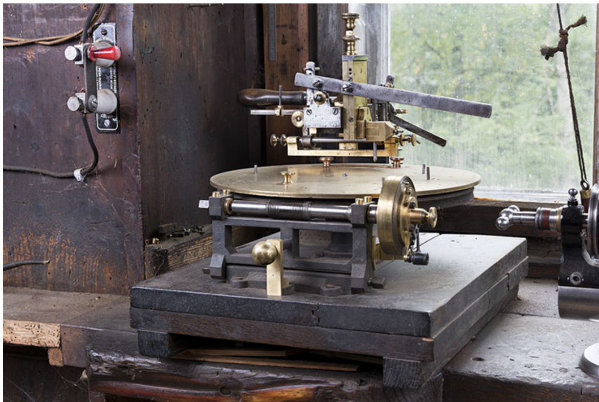
Vue d'ensemble, de trois quarts droite. 25, Les Gras