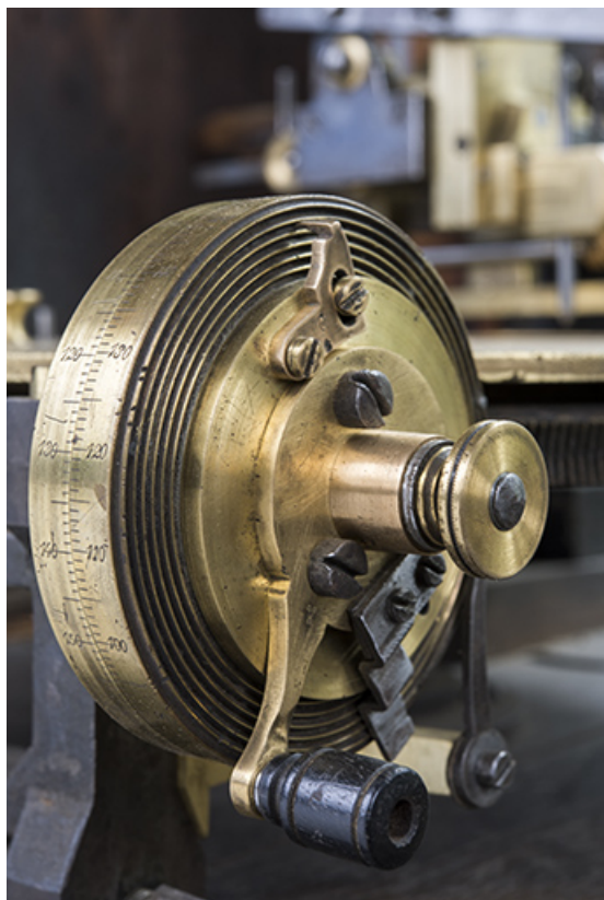
Plateau diviseur : manette et disques gradués du système de mise en rotation. 25, Les Gras