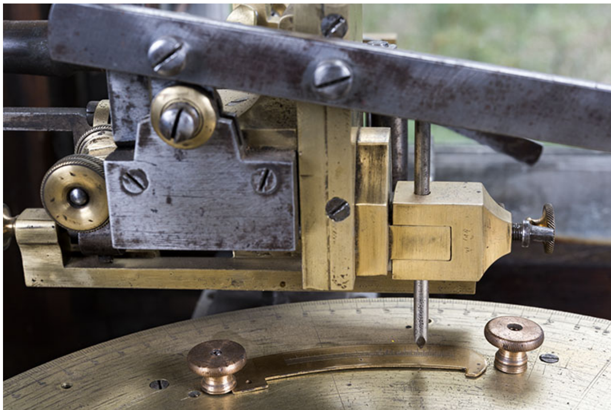
Module de gravage : détail de la pointe à graver. 25, Les Gras