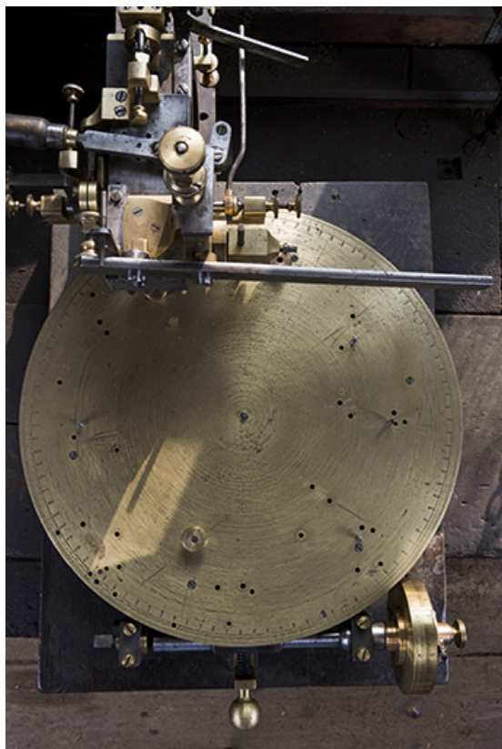
Vue plongeante verticale.