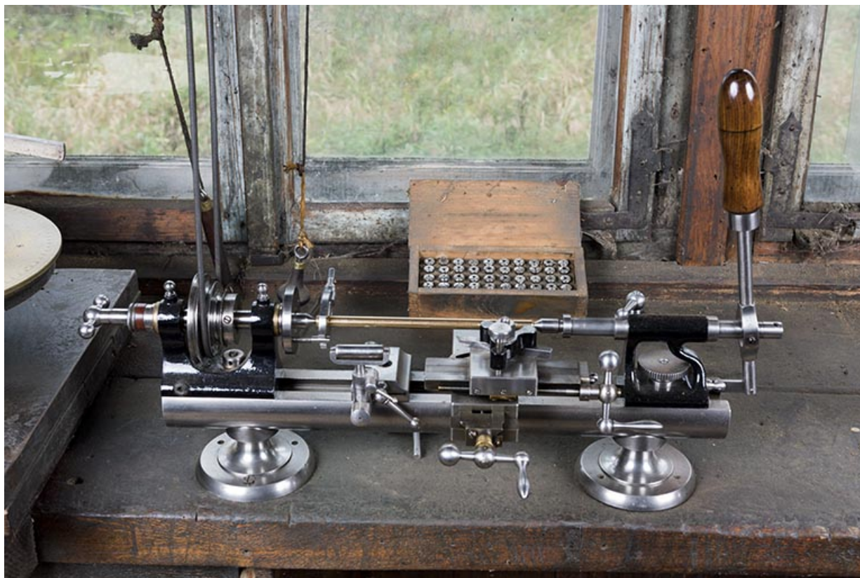
Vue plongeante sur le grand tour et sa caisse d'accessoires.