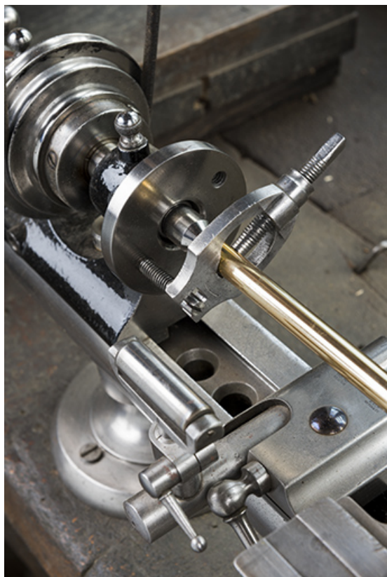
Grand tour : entraîneur et toc (fixé sur la barre). 25, Les Gras