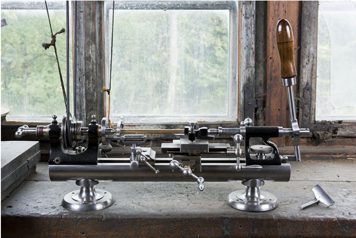
Grand tour, vu de face. A droite, un support d'outil à main. 25, Les Gras