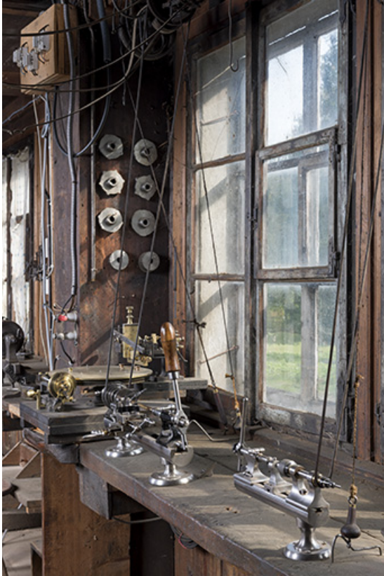
Vue d'ensemble des deux tours.