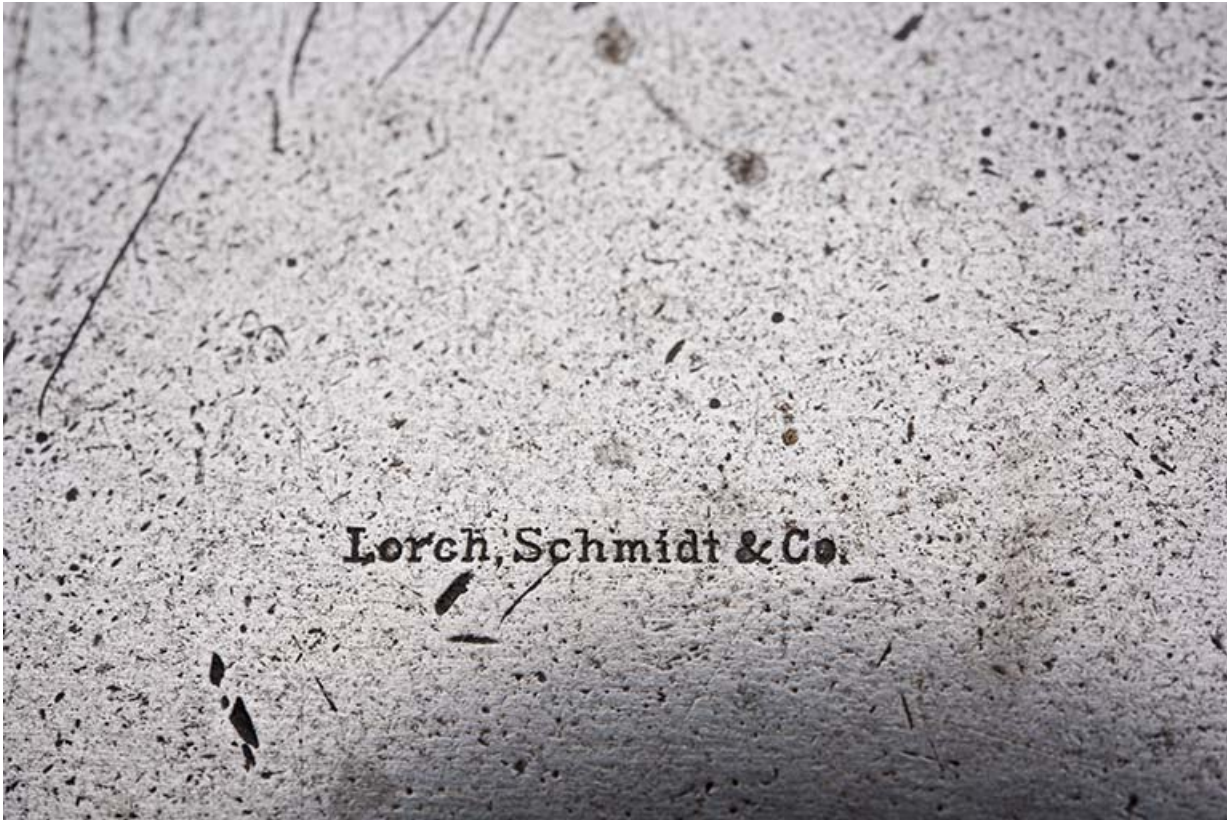
Grand tour : nom du fabricant, à l'extrémité du banc.