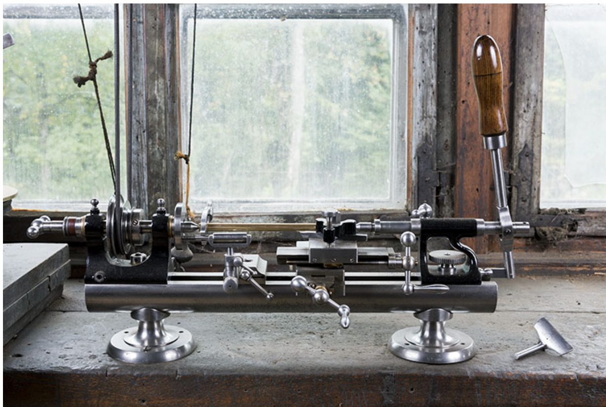
Grand tour, vu de face. A droite, un support d'outil à main. 25, Les Gras