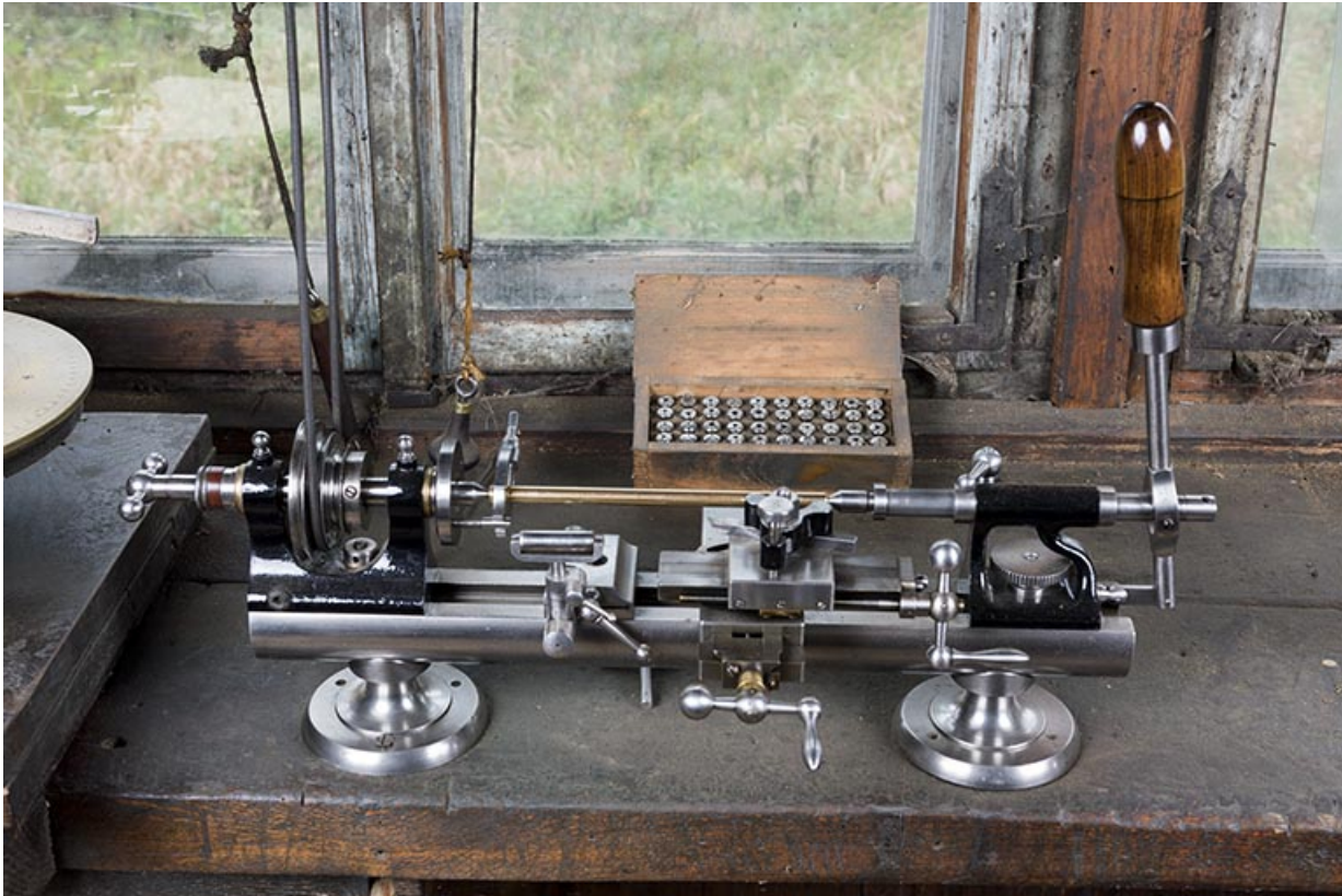
Vue plongeante sur le grand tour et sa caisse d'accessoires.