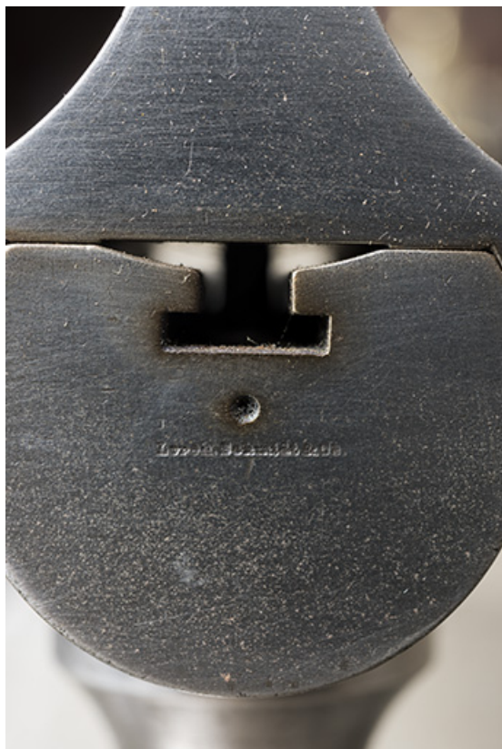
Petit tour : nom du fabricant, à l'extrémité du banc. 25, Les Gras