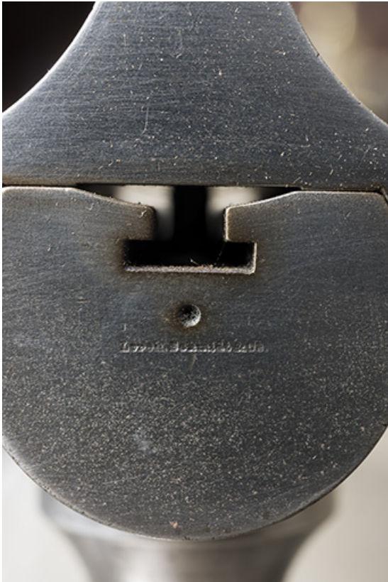
Petit tour : nom du fabricant, à l'extrémité du banc. 25, Les Gras