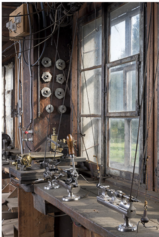
Vue d'ensemble des deux tours.