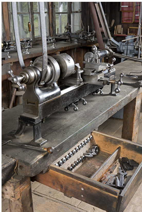
Vue d'ensemble en enfilade, avec le tiroir aux outils et accessoires ouvert. 25, Les Gras