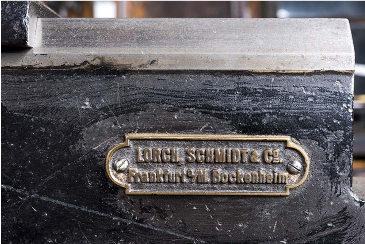
Plaque du constructeur.