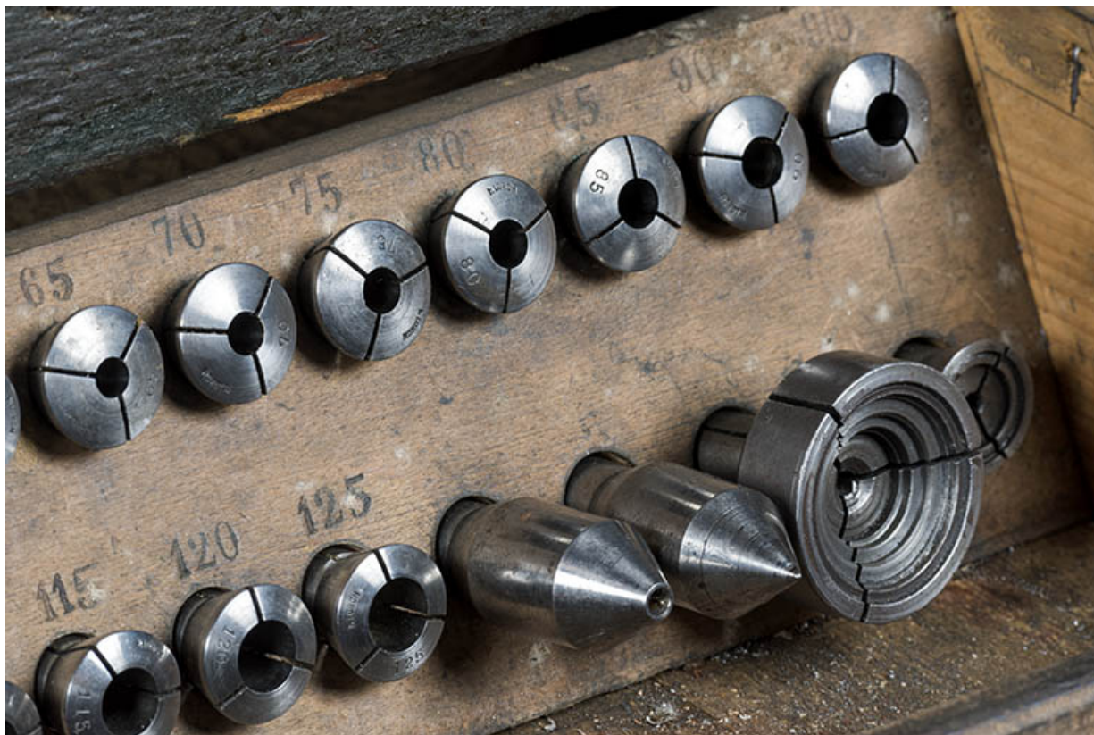
Accessoires (pincettes et pointes).