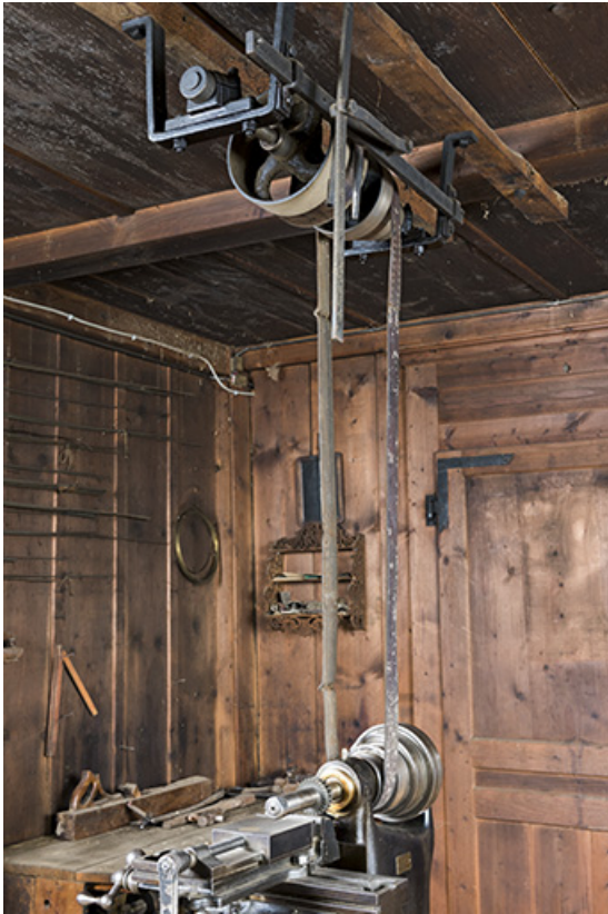
Vue de trois quarts, montrant la transmission. 25, Les Gras