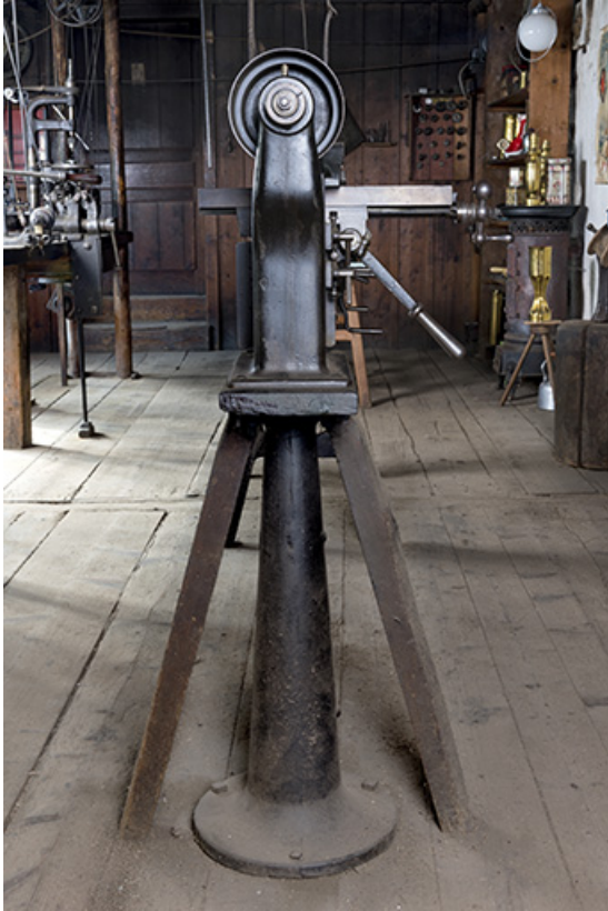
Vue de profil, montrant le socle.