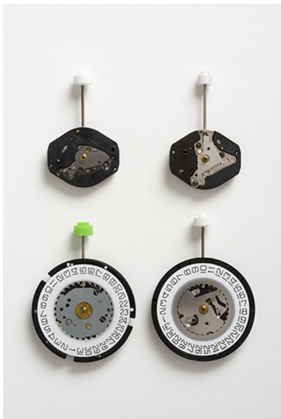
Vue d'ensemble des 4 mouvements : face côté cadran. De gauche à droite et de haut en bas : Isa 2326 et K 63, 317 et 2321. 25, Villers-le-Lac