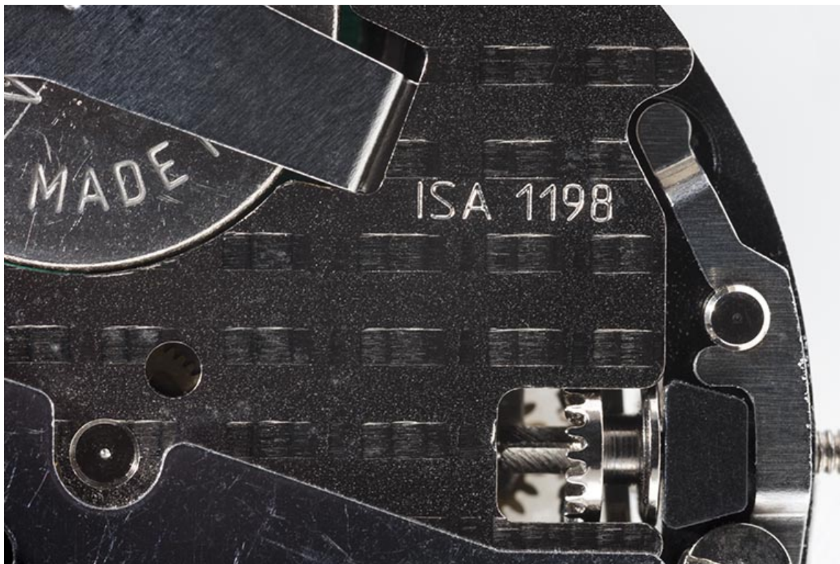
Mouvement ISA 1198 : numéro de modèle. 25, Villers-le-Lac