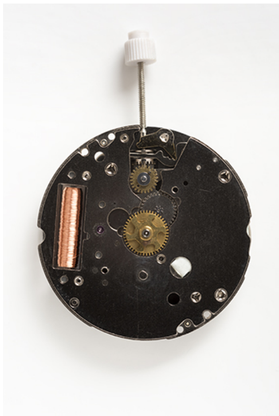
Mouvement ISA 1198 : face côté cadran. 25, Villers-le-Lac