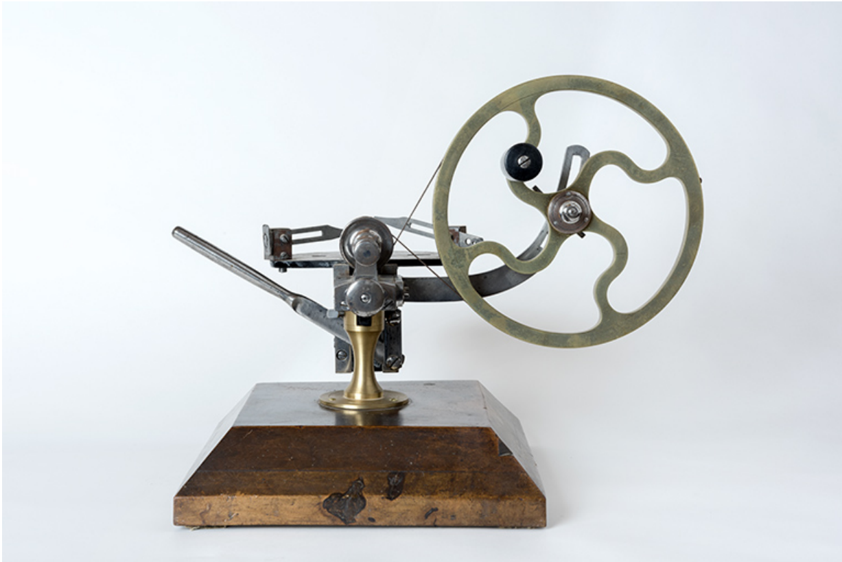
Vue de profil.