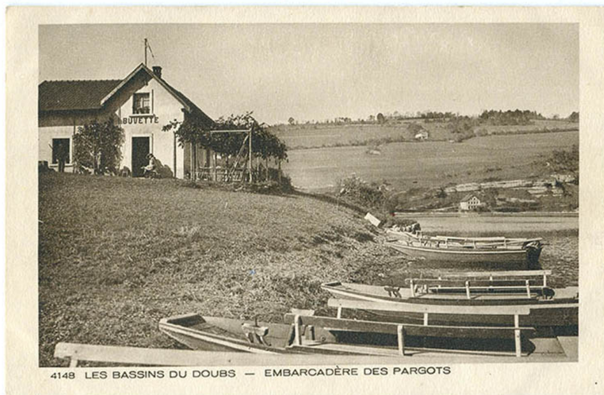
4148 Les bassins du Doubs.- Embarcadère des Pargots [actuel hôtel-restaurant Les Cygnes], 1ère moitié 20e siècle. 25, Villers-le-Lac, 16 rue de l' Ile, lieudit : les Bassots

4148 Les bassins du Doubs.- Embarcadère des Pargots [actuel hôtel-restaurant Les Cygnes], carte postale, s.n., s.d. [1ère moitié 20e siècle], Braun et Cie impr.-éd. à Mulhouse-Dornach. Collection Le Jura Lieu de conservation : Collection particulière : Henri Ethalon, Les Ecorces