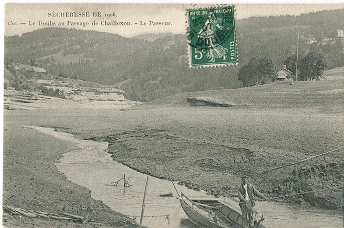
Sécheresse de 1906. 152. - Le Doubs au Passage de Chaillexon. - Le Passeur.

25, Villers-le-Lac, 16 rue de l' Ile, lieudit : les Bassots