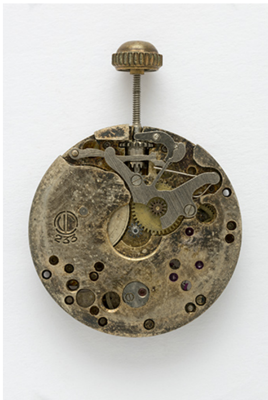
Mouvement Cupillard VC 233 : face côté cadran. 25, Villers-le-Lac