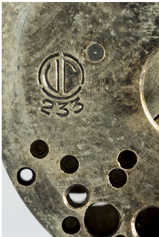
Logotype Cupillard et numéro de modèle. 25, Villers-le-Lac