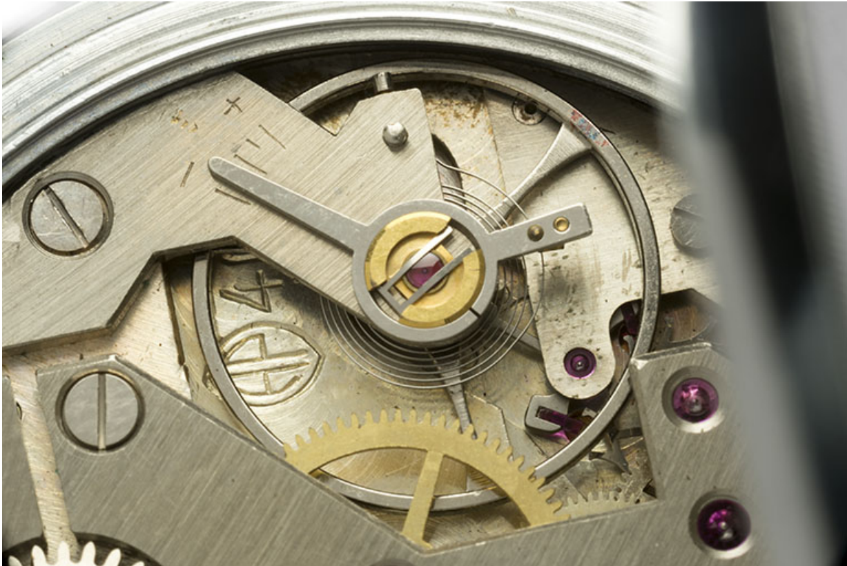
2e montre, mouvement Parrenin HP 40 : logotype et numéro de modèle gravés près du pont de balancier. 25, Villers-le-Lac