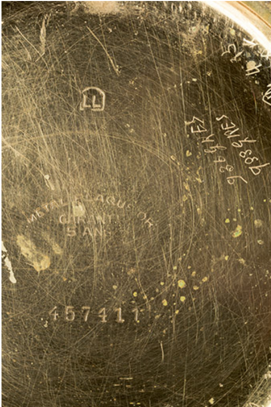
Inscriptions (manuscrites ou non) gravées dans le fond.