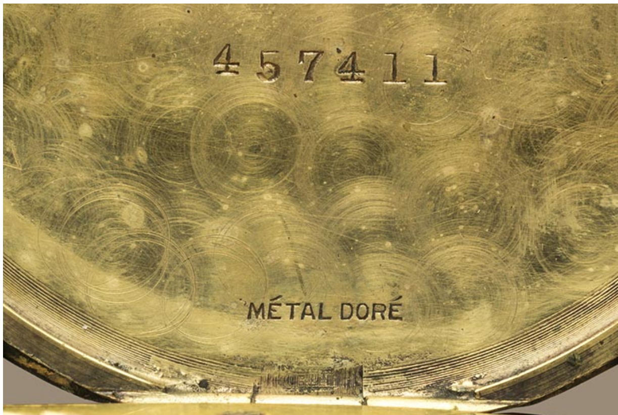
Inscriptions liées au boîtier, gravées dans la cuvette.