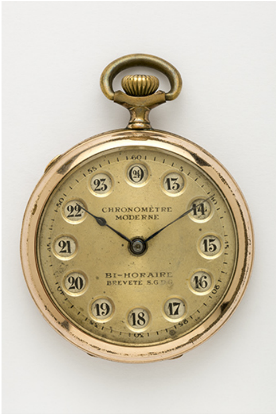
Face supérieure, avec affichage des heures de 13 à 24.