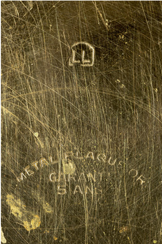
Inscriptions liées au boîtier, gravées dans le fond.