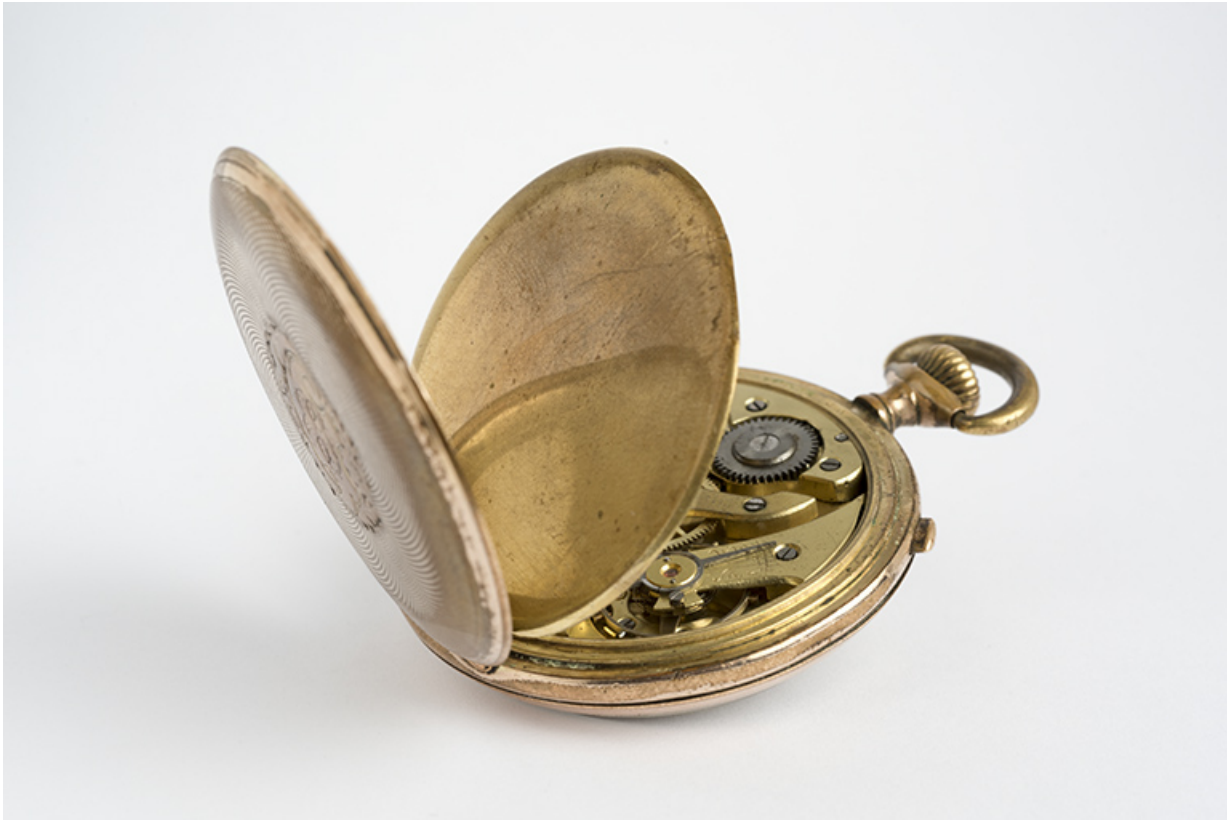
Vue de trois quarts à plat, fond et cuvette ouverts.