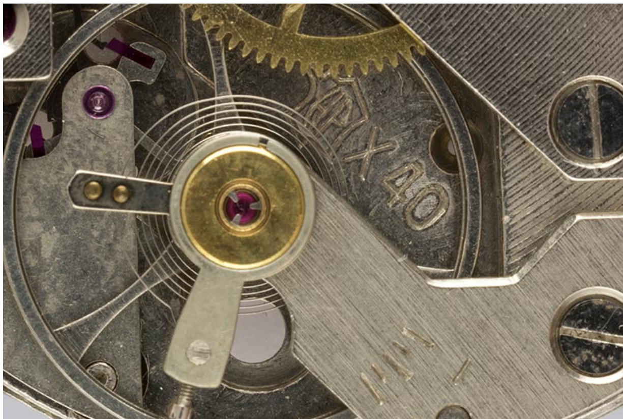
Logotype Parrenin et numéro de modèle. 25, Villers-le-Lac