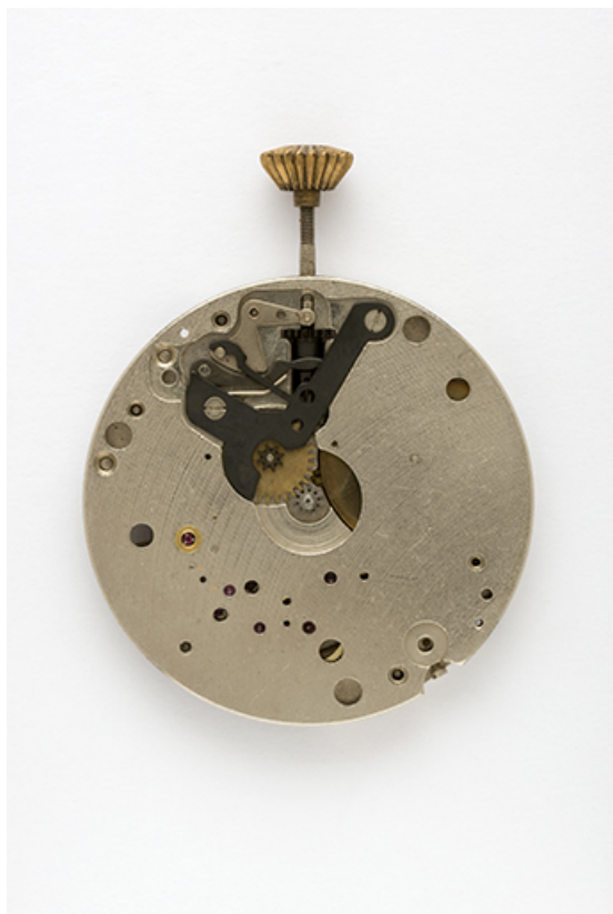
Mouvement Parrenin HP X40 : face côté cadran. 25, Villers-le-Lac