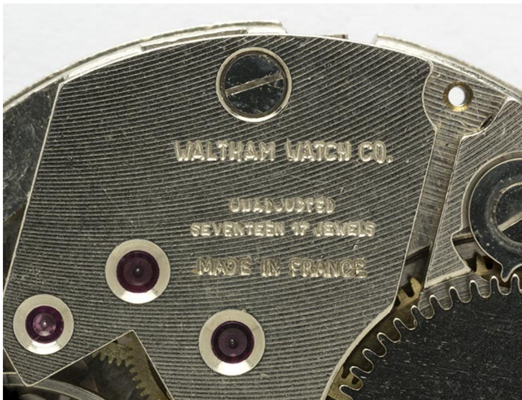
Inscription identifiant le destinataire : la Waltham Watch Company. 25, Villers-le-Lac