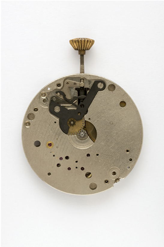
Mouvement Parrenin HP X40 : face côté cadran. 25, Villers-le-Lac