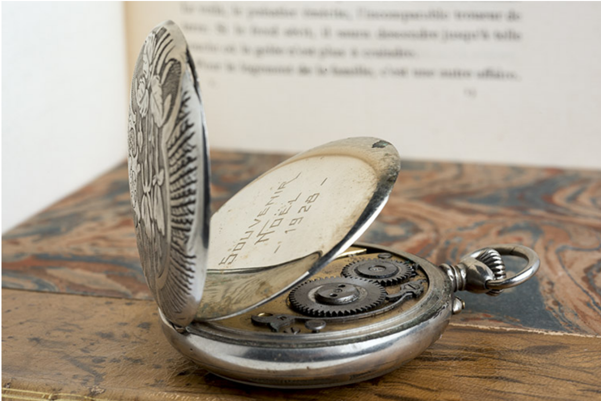
Montre de gousset mécanique de la marque Régulateur français, à Villers-le-Lac.