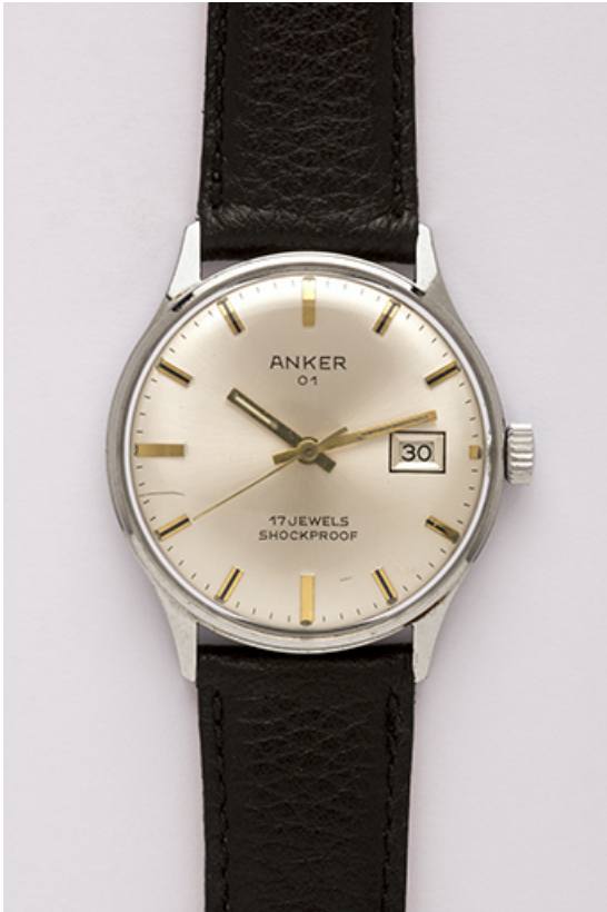
Montre-bracelet mécanique Anker 01 (années 1960-1970), par la société Uhrenfabrik Wilhelm Eppler GmbH, de Villingen-Schwenningen (Allemagne), équipée d'un calibre Parrenin HP 60 G. 25, Villers-le-Lac