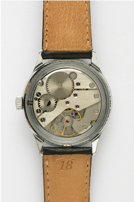
Mouvement Parrenin HP 60 G.