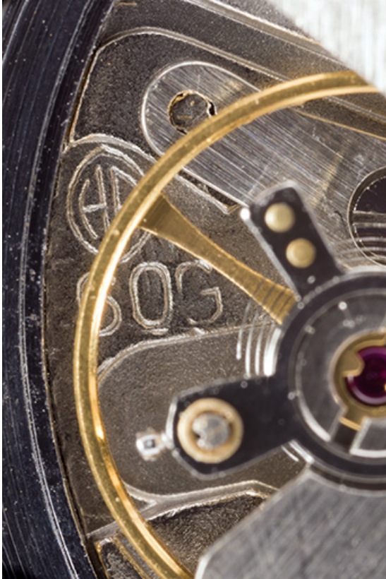
Logotype Parrenin et numéro de modèle.