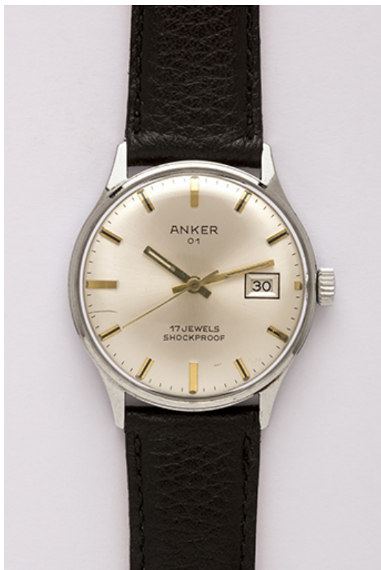
Montre-bracelet mécanique Anker 01 (années 1960-1970), par la société Uhrenfabrik Wilhelm Eppler GmbH, de Villingen-Schwenningen (Allemagne), équipée d'un calibre Parrenin HP 60 G.