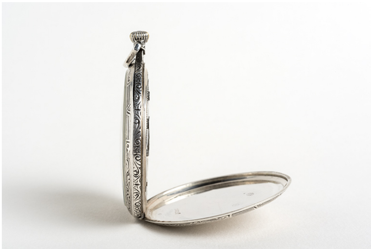
Vue de profil, fond ouvert.