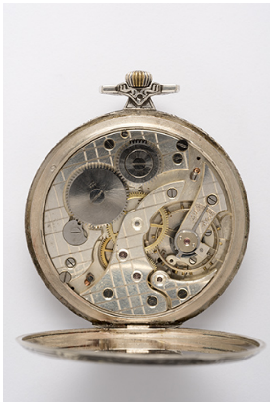
Mouvement Parrenin : calibre HP 18,5 U.