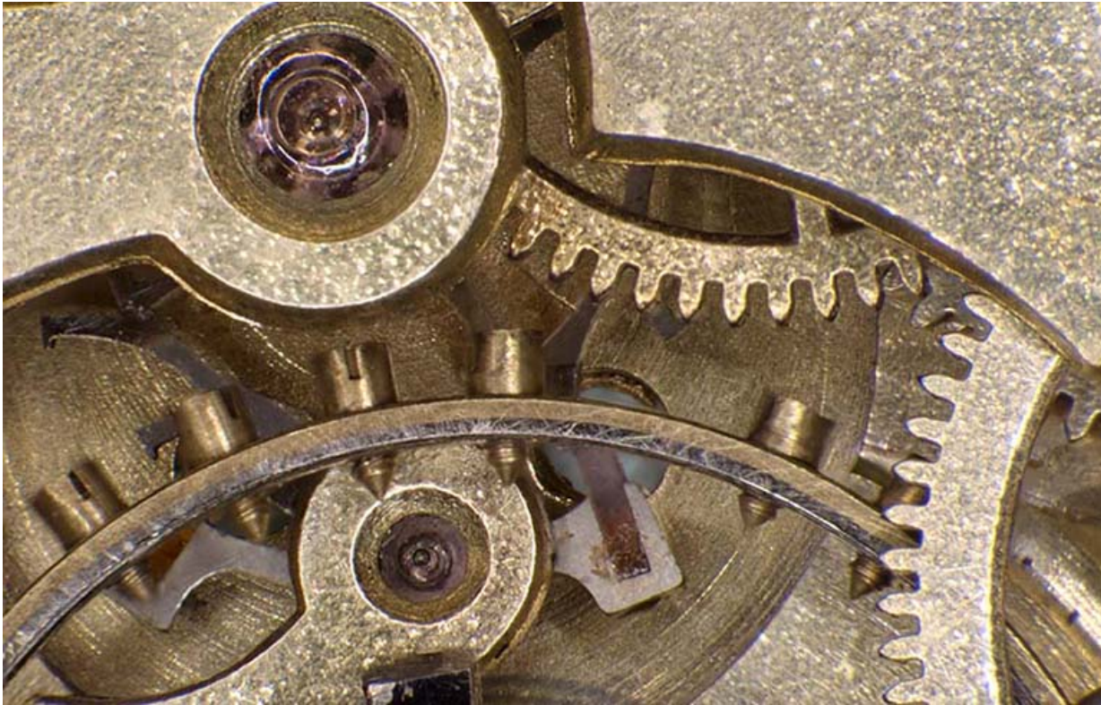
Mouvement, détails : contre-pivot en rubis, balancier à vis, ancre (avec ses palettes en rubis) et roue d'ancre. 25, Villers-le-Lac

N° de l'illustration : 20162500349NUC4AQ