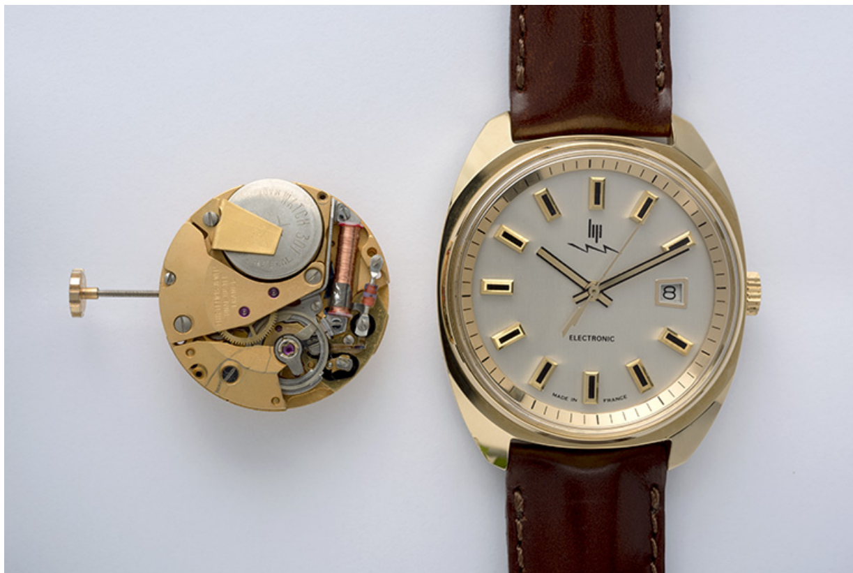
Montre-bracelet électromécanique dite Lip Electronic, à côté d'un mouvement Lip R 184 vu côté ponts. 25, Maîche