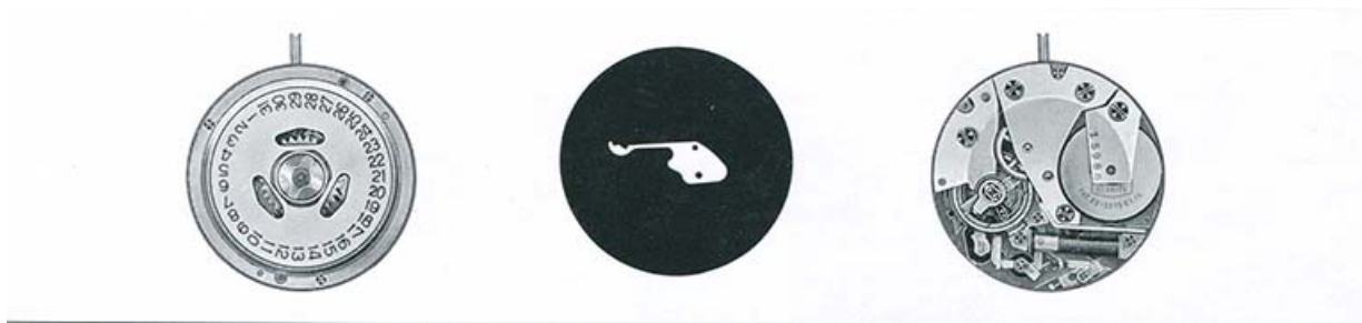
[Dessin du mouvement Lip R 184], 1973.