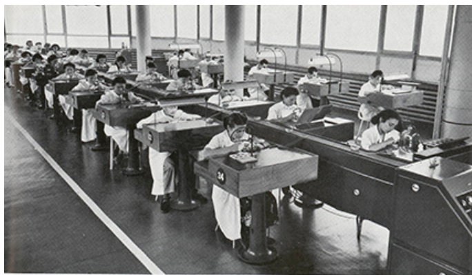
La chaîne de montage livre une montre en marche toutes les 25 secondes