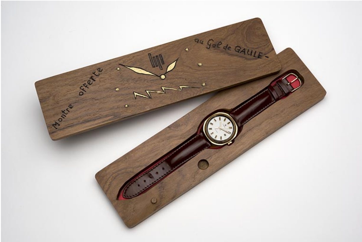
La montre dans son étui.