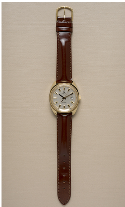
Vue d'ensemble de la montre.