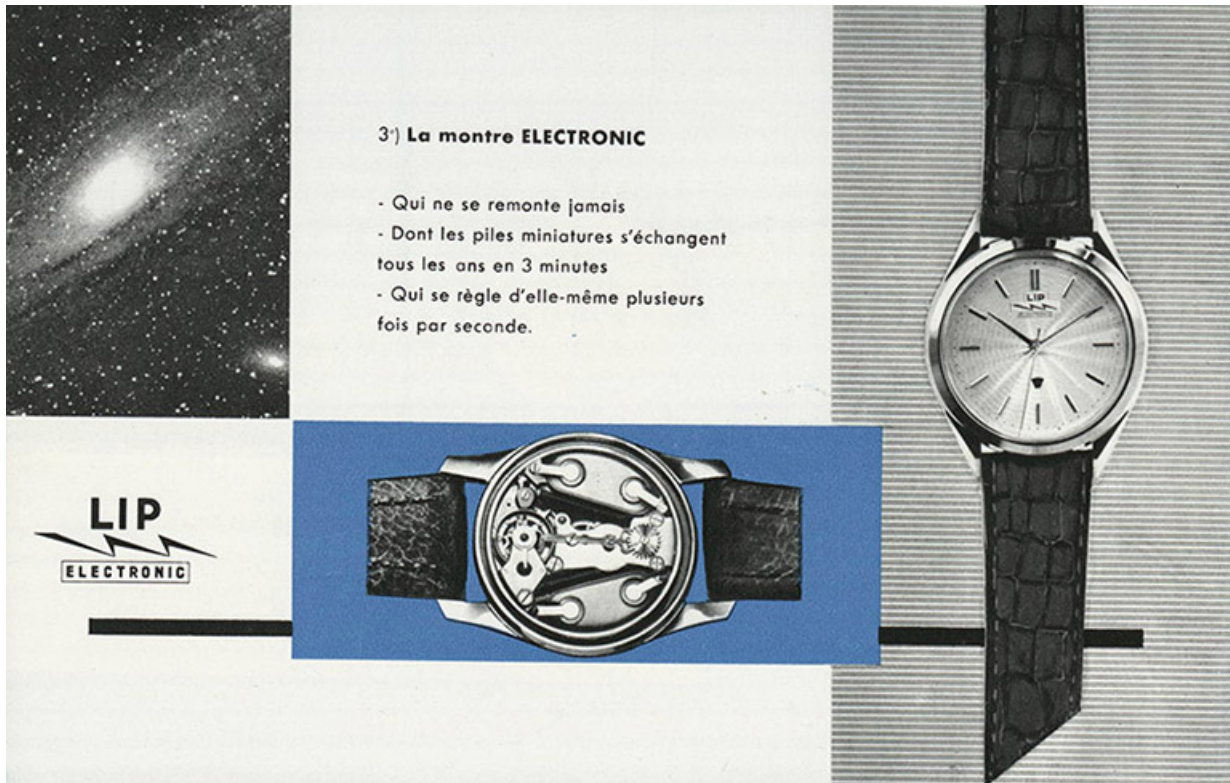
La montre Electronic, fotogr., 1956. 25, Maïche