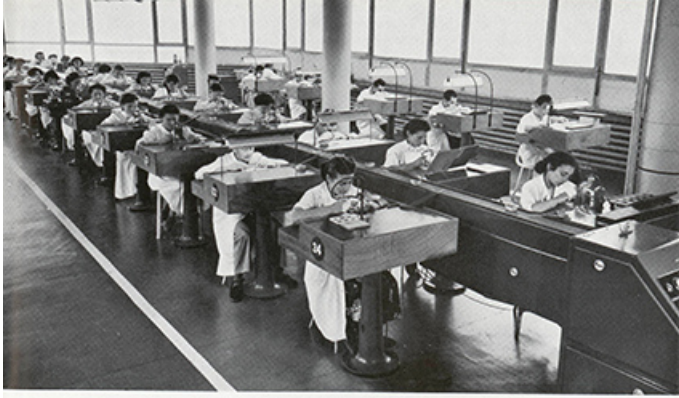
La chaîne de montage livre une montre en marche toutes les 25 secondes