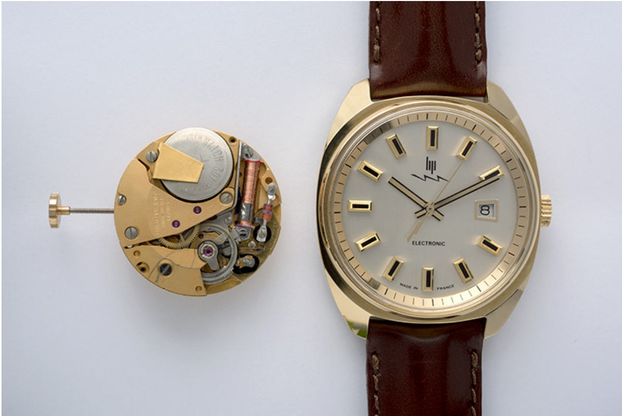
Montre-bracelet électromécanique dite Lip Electronic, à côté d'un mouvement Lip R 184 vu côté ponts. 25, Maîche