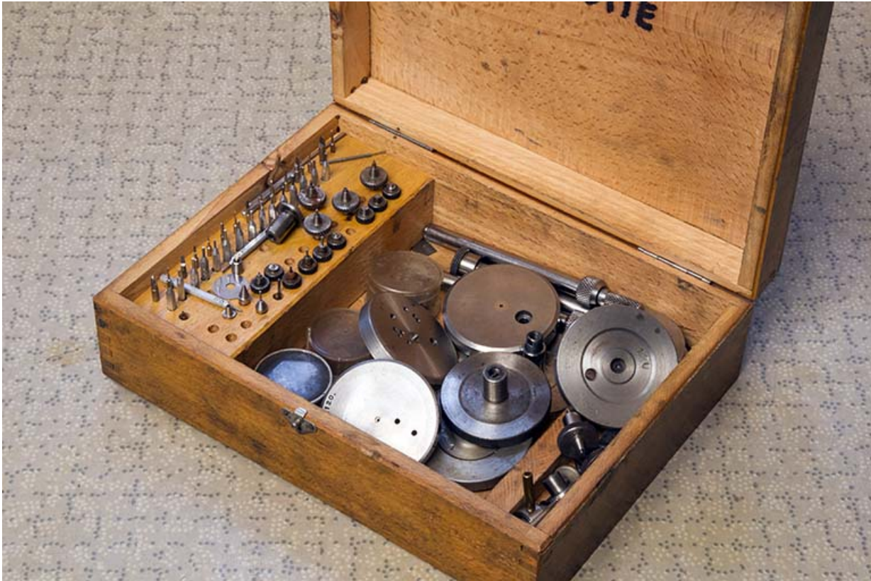
Exemple d'outils associés à la potence à chasser.