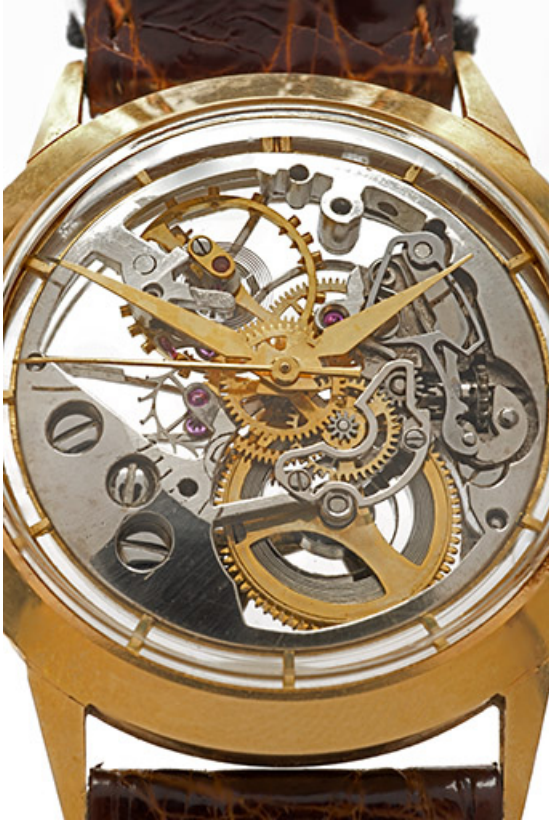
Face supérieure, de trois quarts (le remontoir est à droite).