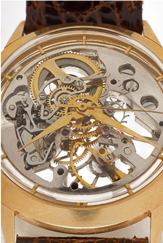
Face supérieure, de trois quarts (le remontoir est à gauche).