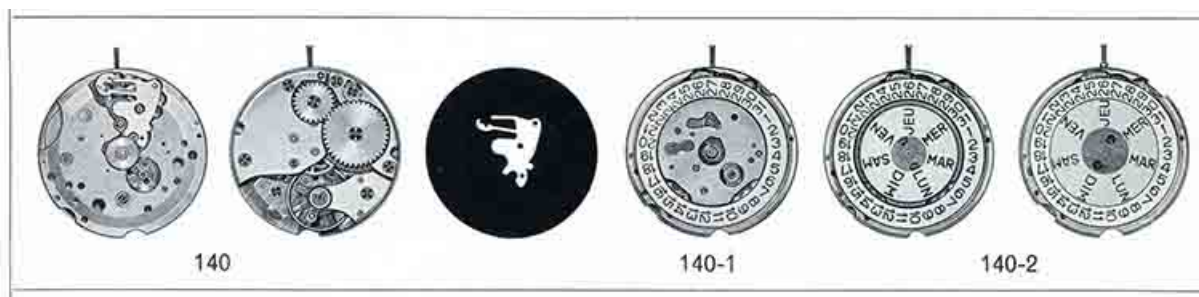
[Dessin des mouvements FE 140, 140-1 et 140-2], 1973.