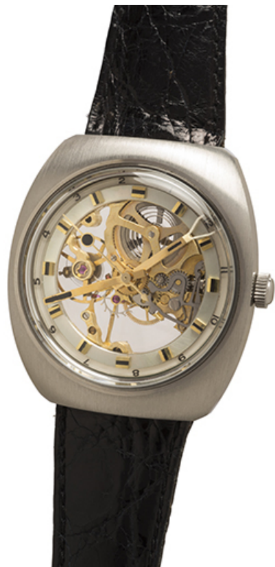
Montre-squelette fabriquée en 1971 par Jacques Donzé, pour illustrer le principe développé dans son brevet de 1968. 25, Charquemont, 12 Rue Neuve