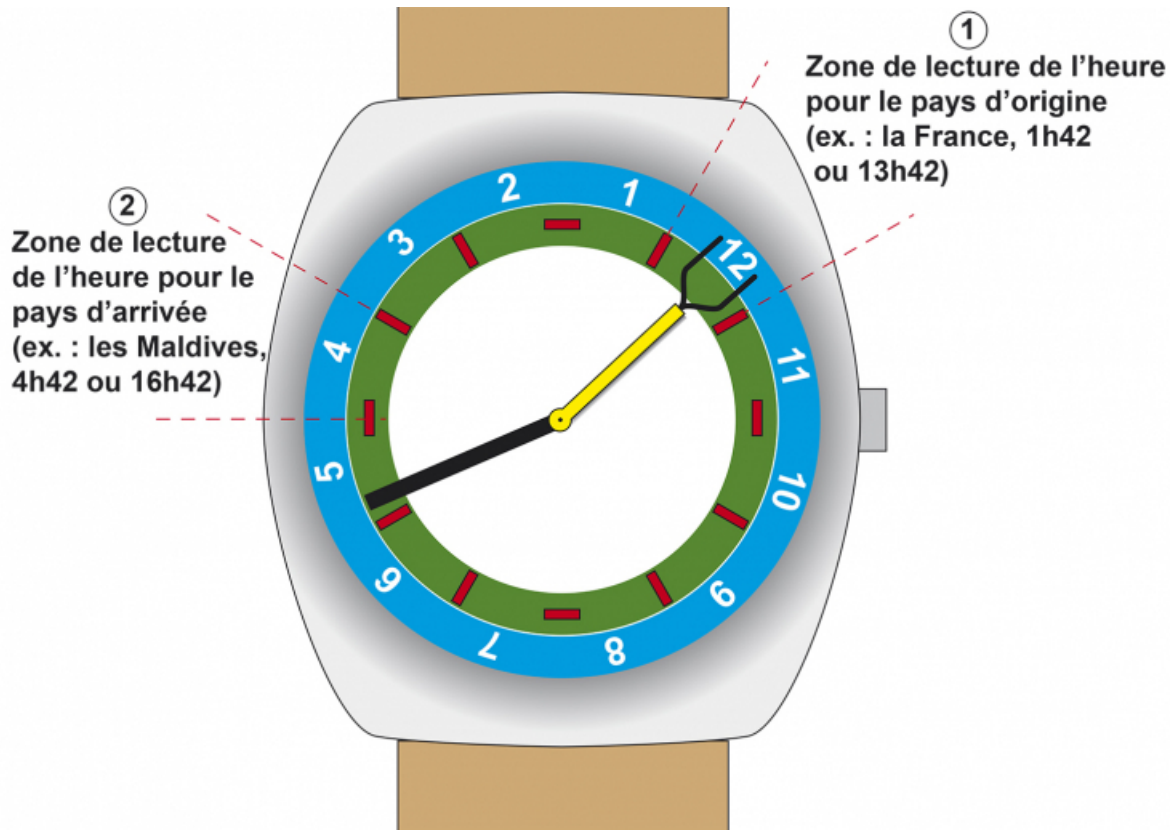
Schéma de principe pour l'utilisation de la montre.