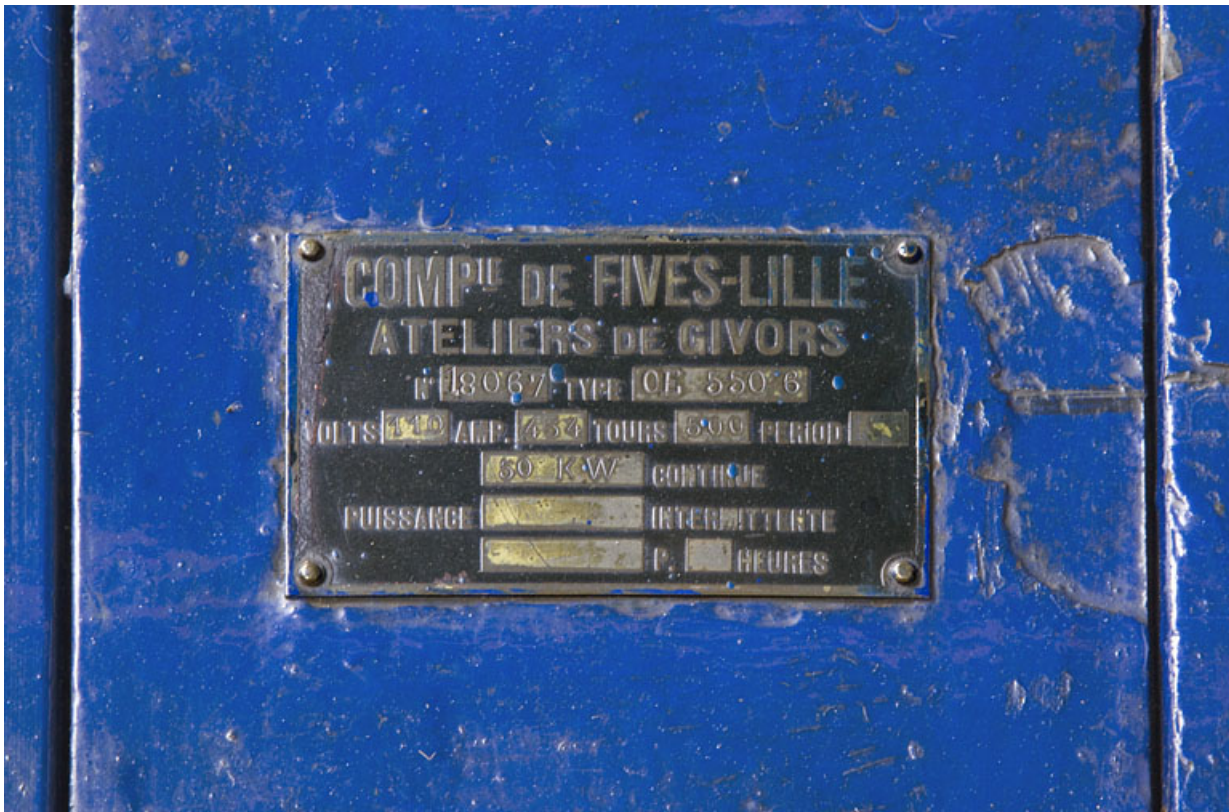
Groupe n° 1 : plaque signalétique de l'excitatrice.