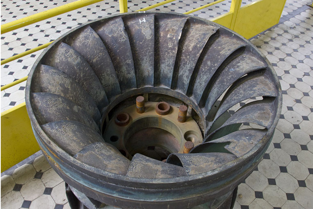
Extrémité des aubes de la roue d'une turbine Francis double.