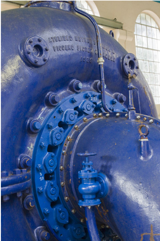
Groupe n° 1 : bâche de la turbine, avec inscription. 25, Charquemont, lieudit : Mortier