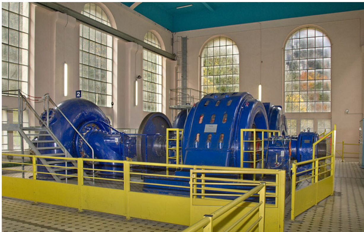
Groupe n° 2 : face avant.