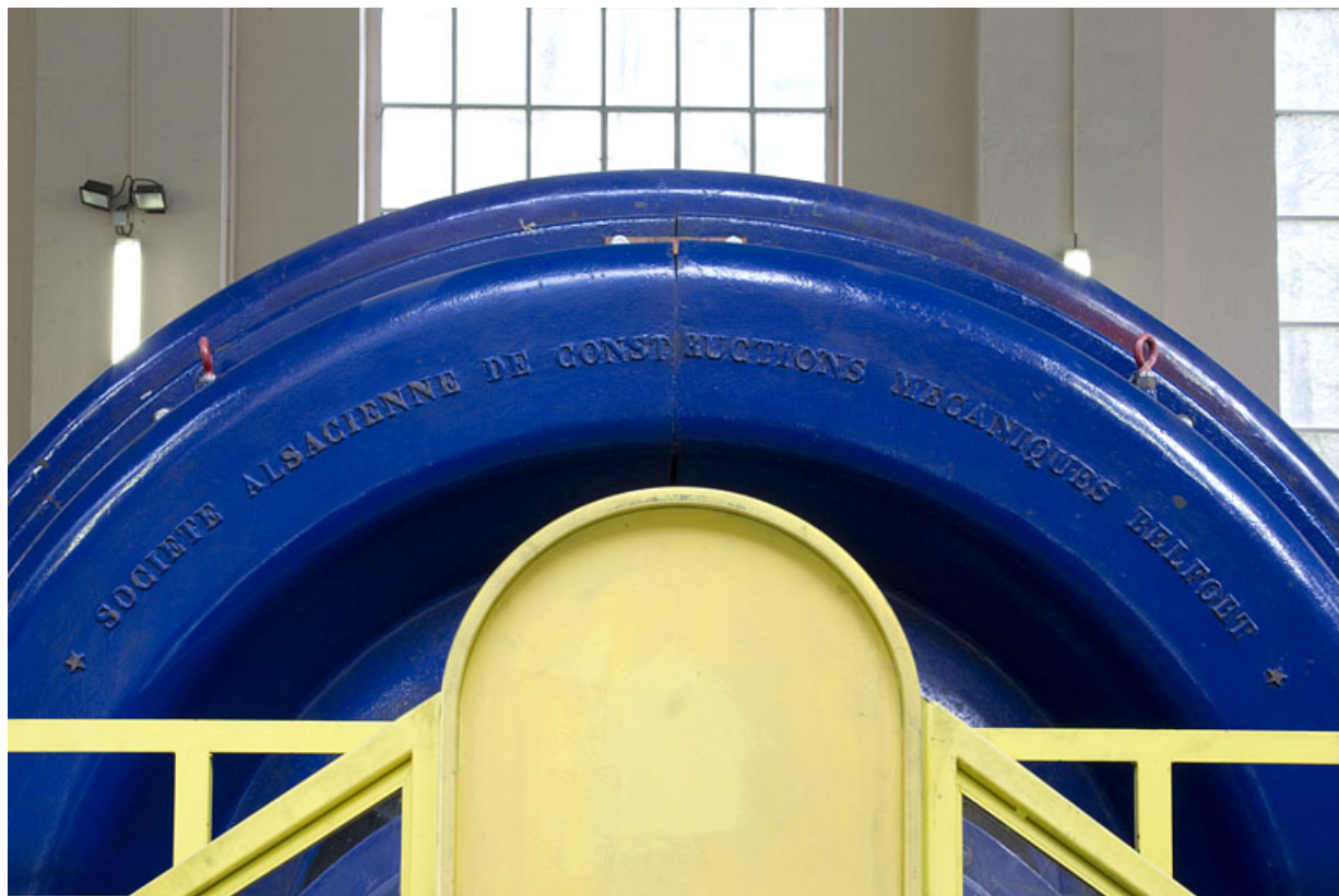
Groupe n° 2 : inscription sur le capot de l'alternateur.