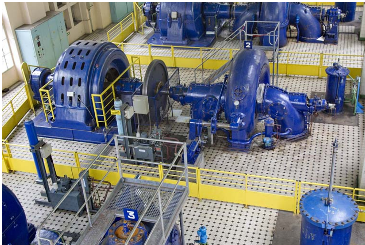
Groupe n° 2 : face arrière.