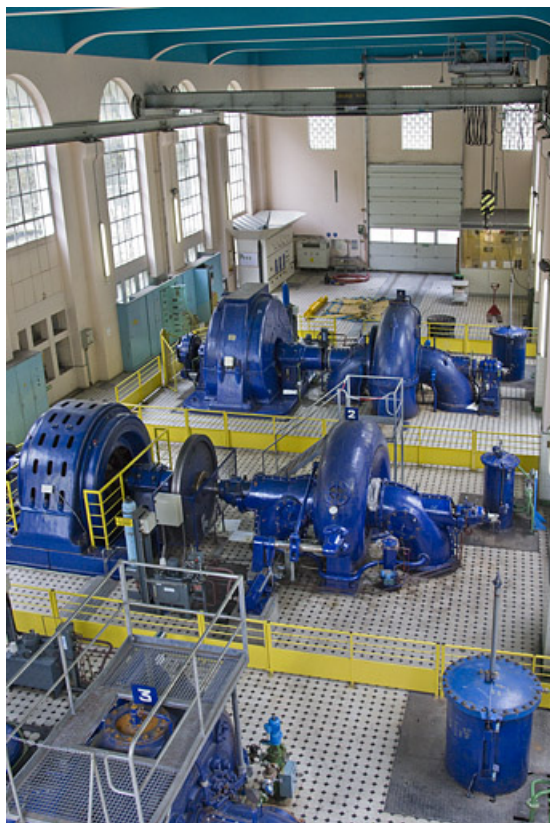
Vue d'ensemble de la salle des machines et des groupes n° 1 et 2. 25, Charquemont, lieudit : Mortier