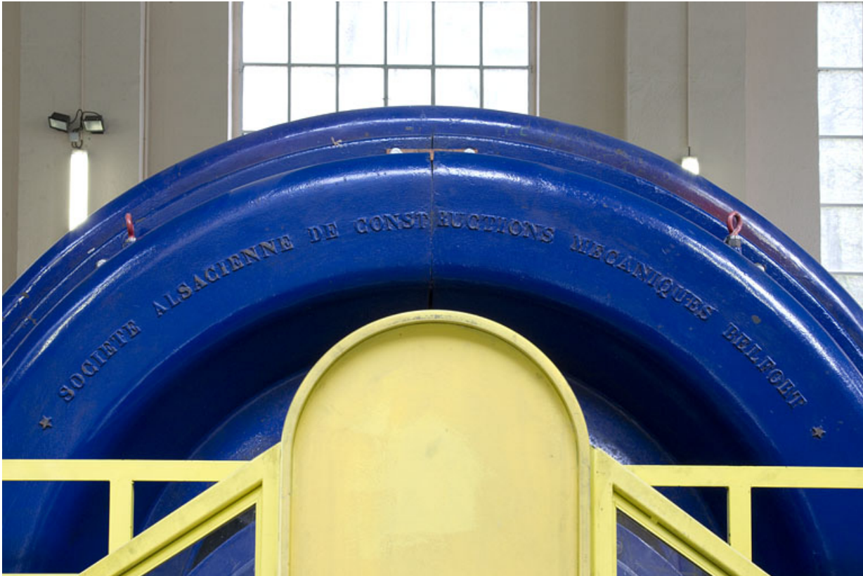
Groupe n° 2 : inscription sur le capot de l'alternateur.