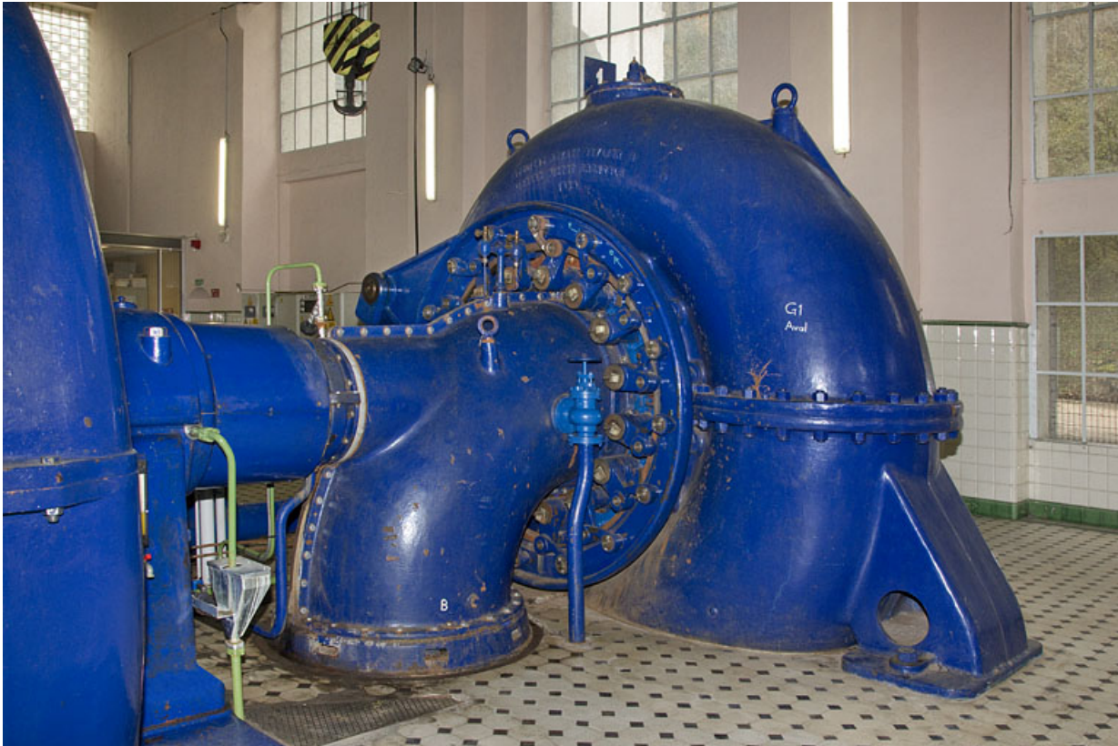
Groupe n° 1 : bâche de la turbine.