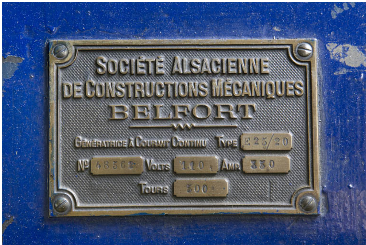
Groupe n° 2 : plaque signalétique de l'alternateur.