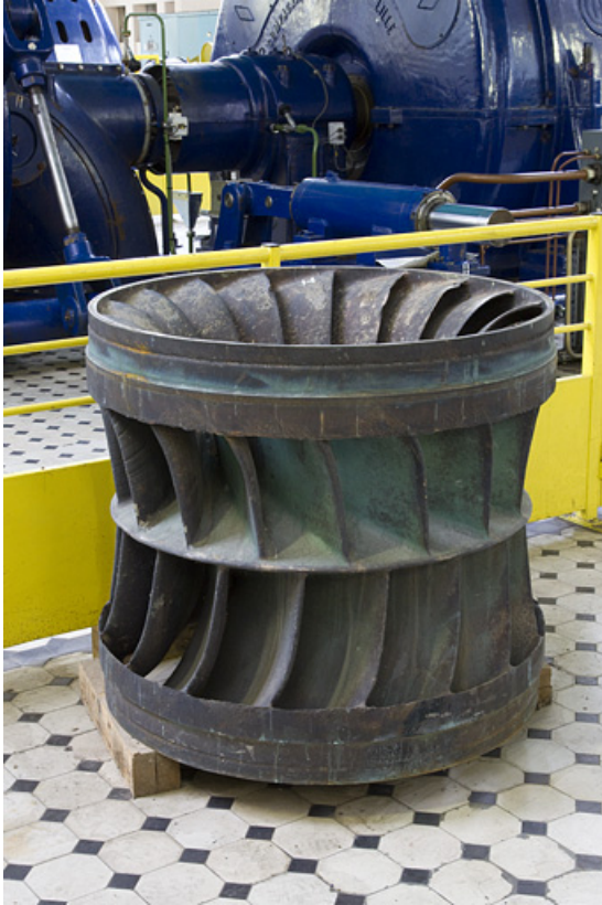
Roue d'une turbine Francis double.