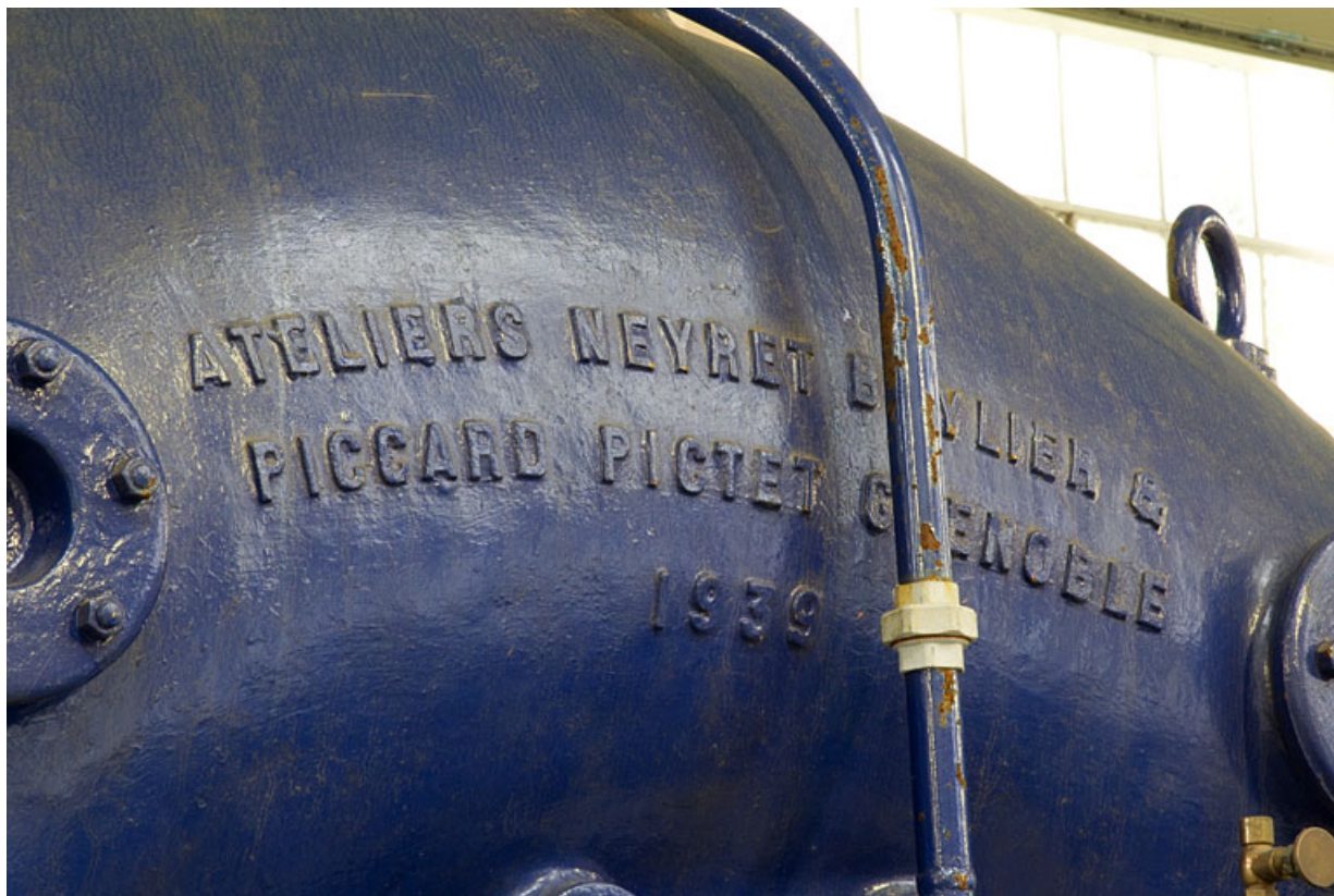
Groupe n° 1 : inscription sur la bache de la turbine.