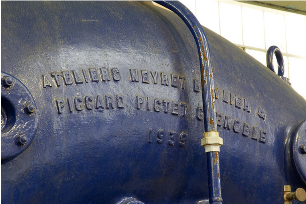
Groupe n° 1 : inscription sur la bache de la turbine.