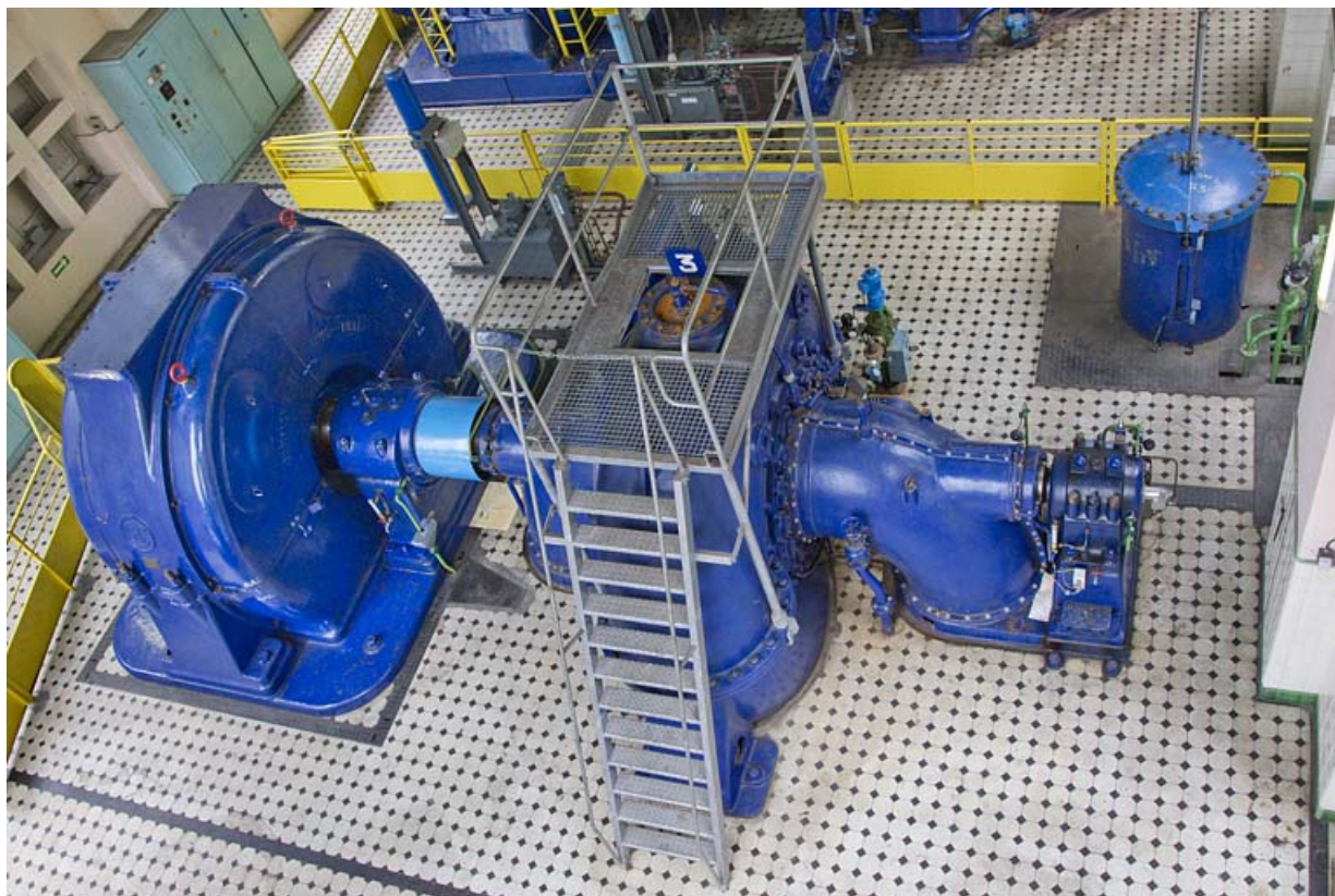
Groupe n° 3 : face arrière (vue plongeante). 25, Charquemont, lieudit : Mortier