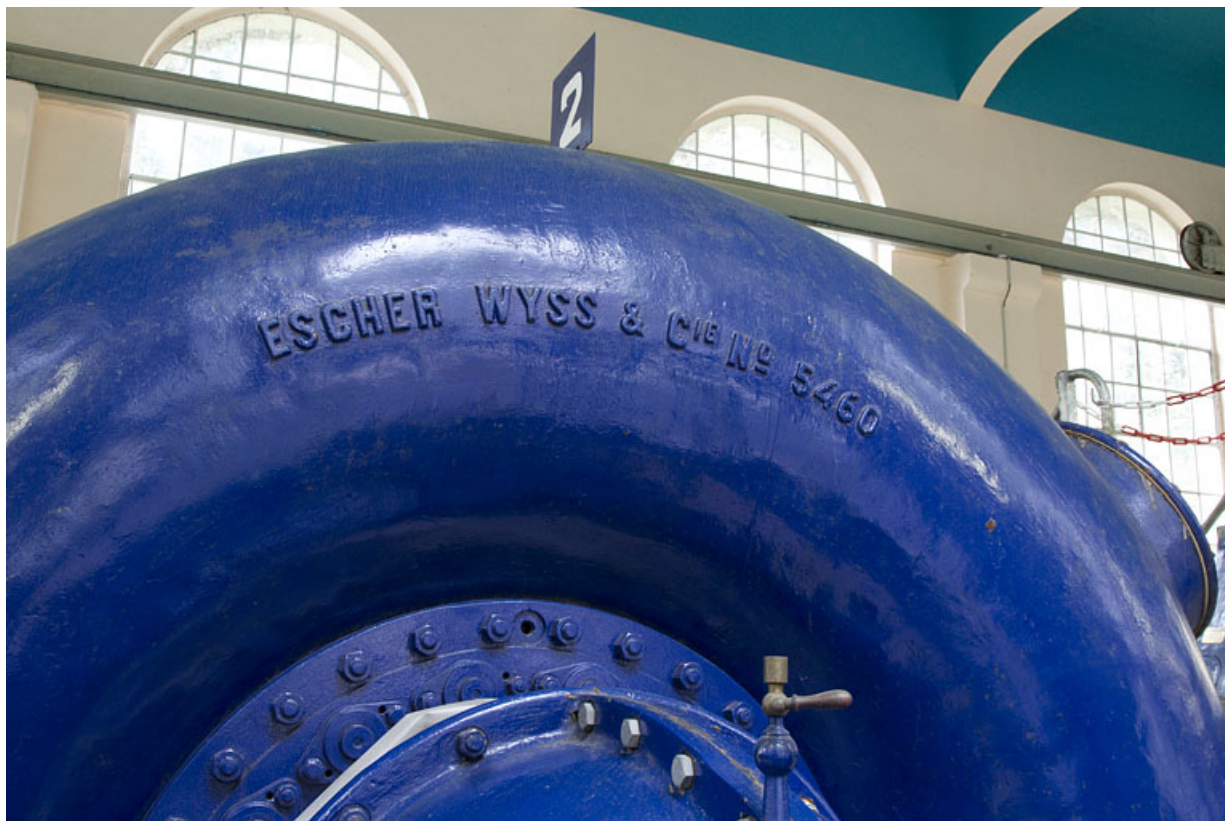
Groupe n° 2 : inscription sur la bache de la turbine.