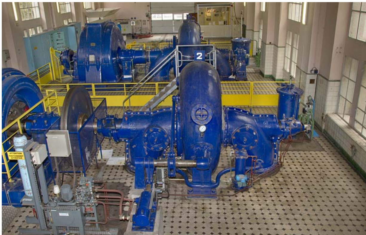
Groupe n° 2 : bête de la turbine.