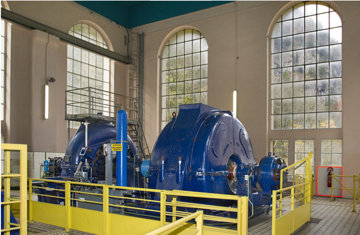
Groupe n° 3 : face avant.