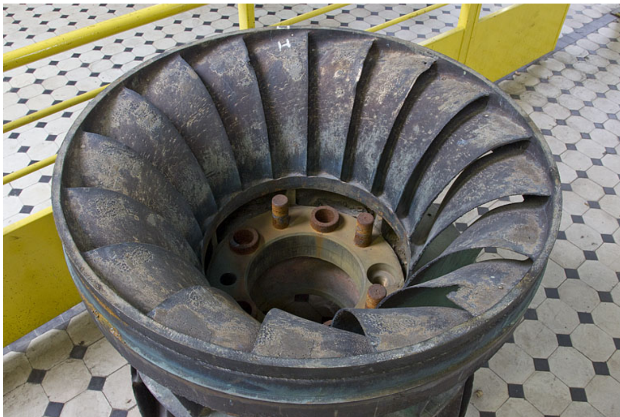
Extrémité des aubes de la roue d'une turbine Francis double.