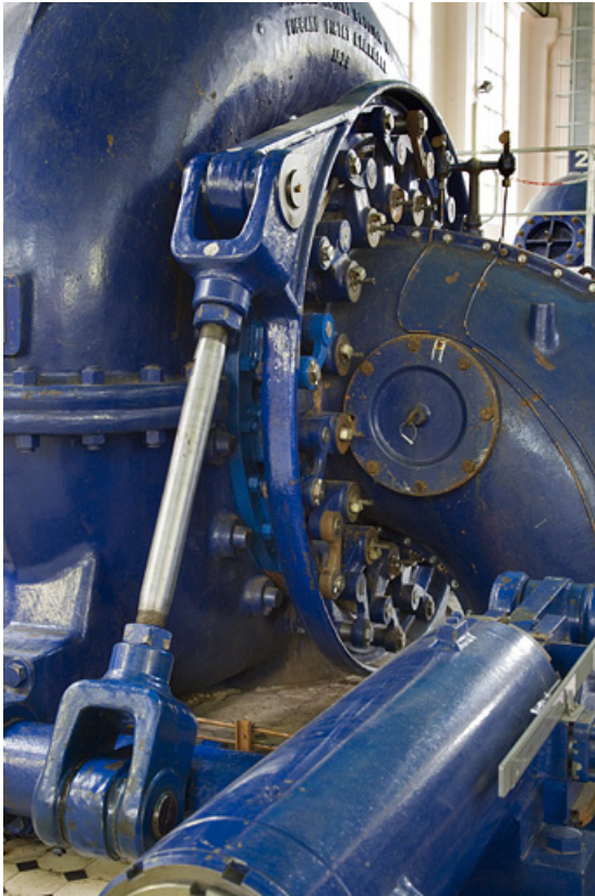
Groupe n° 1 : bras et cercle de vannage de la turbine, permettant d'en régler le débit. 25, Charquemont, lieudit : Mortier