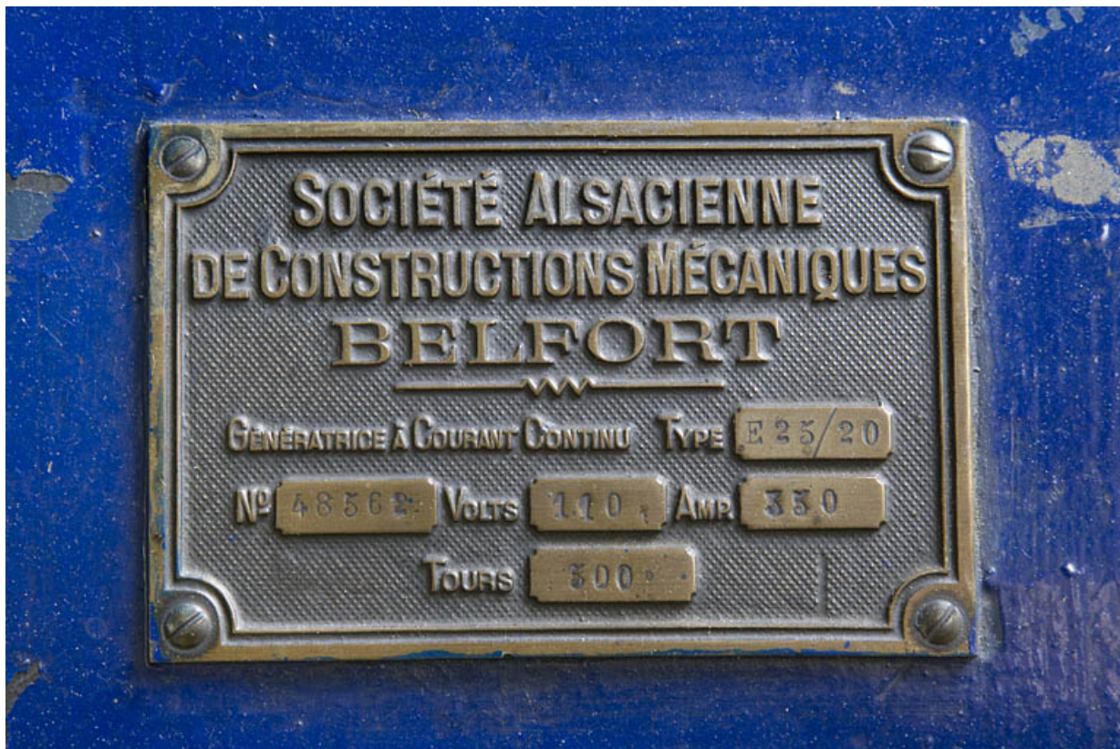
Groupe n° 2 : plaque signalétique de l'alternateur.