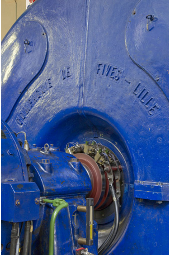
Groupe n° 1 : inscription sur le capot de l'alternateur.