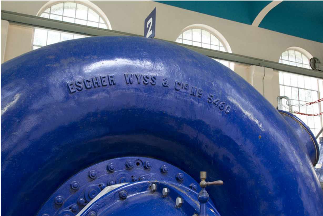
Groupe n° 2 : inscription sur la bâche de la turbine.