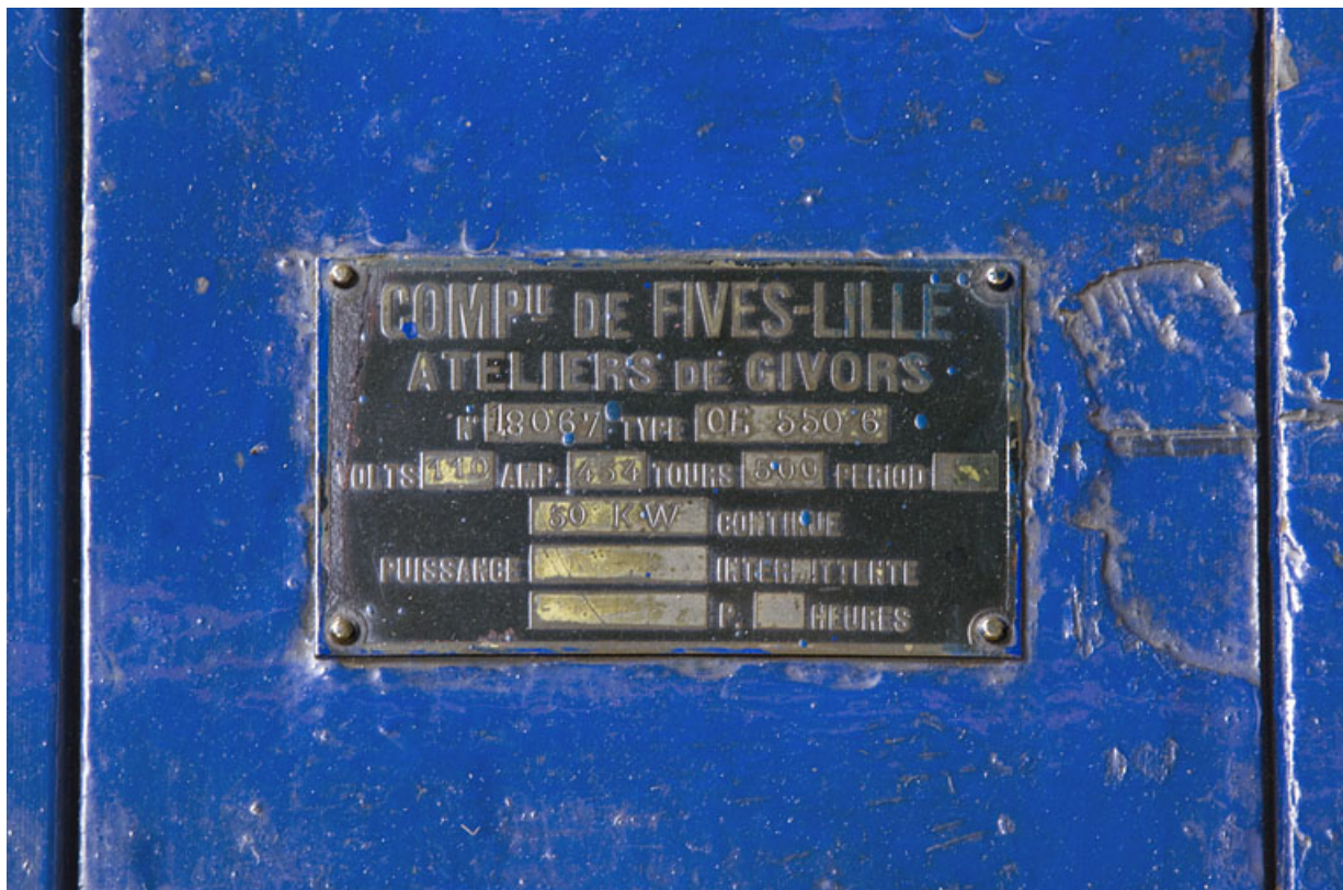
Groupe n° 1 : plaque signalétique de l'excitatrice.