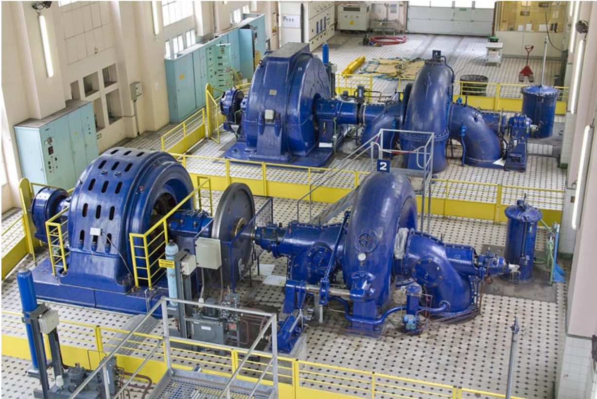
Vue d'ensemble plongeante sur les groupes n° 1 et 2.