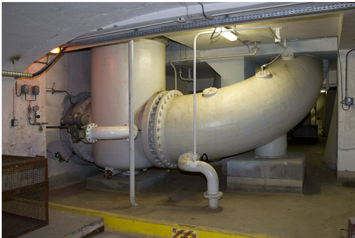
Groupe n° 1 : conduites d'amenée d'eau, à l'étage de soubassement.