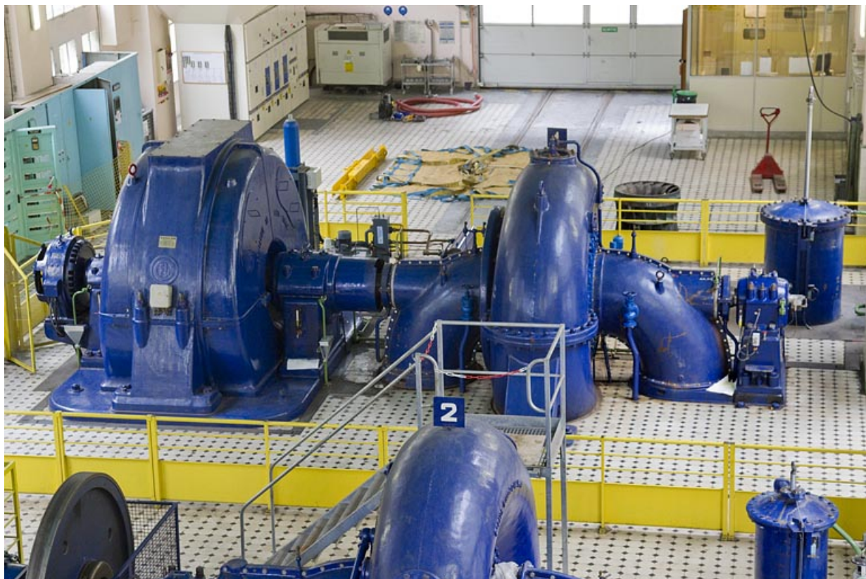
Groupe n° 1 : face arrière.