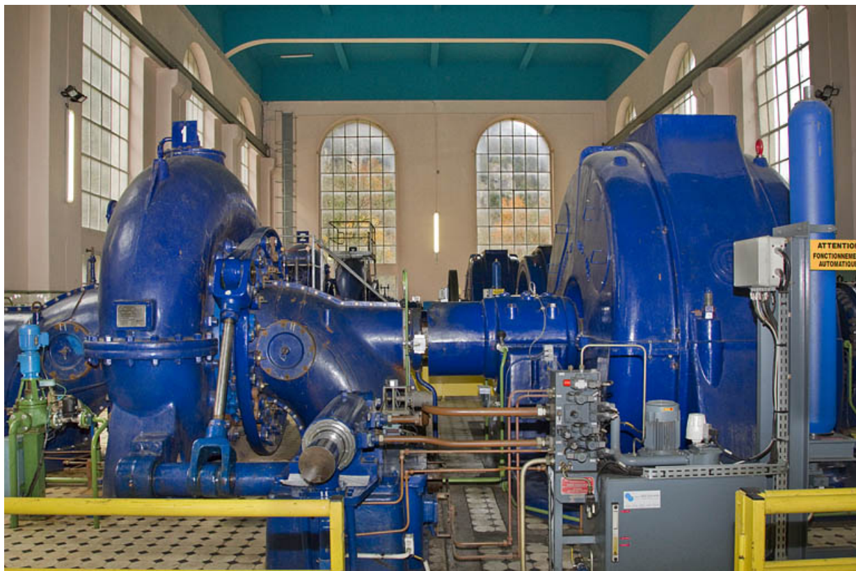
Groupe n° 1 : face avant.