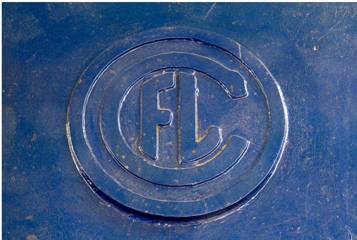
Groupe n° 1 : logotype sur le capot de l'alternateur.