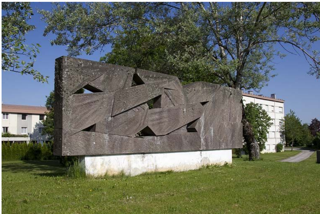
Face antérieure, de trois quarts gauche.