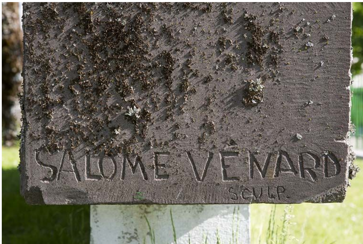
Signature sur la face latérale gauche.