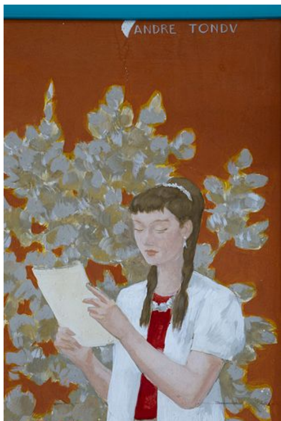
Panneau à droite de l'entrée des garçons : signature du peintre Tondv. 25, Pontarlier, 3 rue des Fusillés