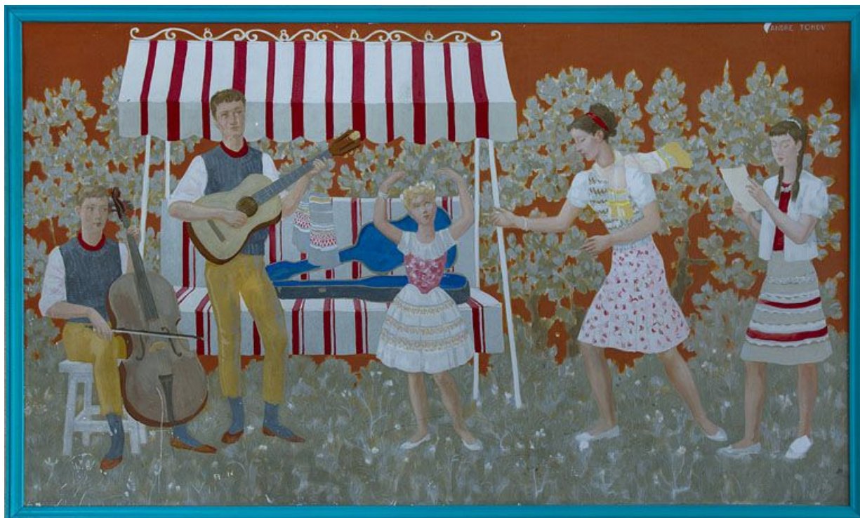
Panneau à droite de l'entrée des garçons.