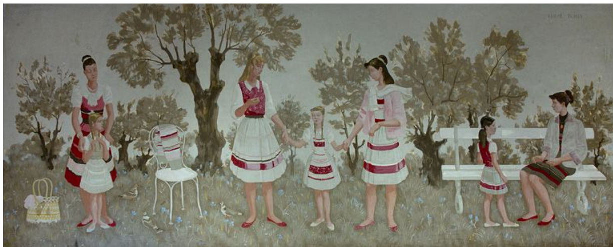
Panneau à droite de l'entrée des filles.