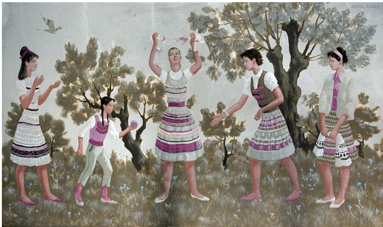
Panneau à gauche de l'entrée des filles.