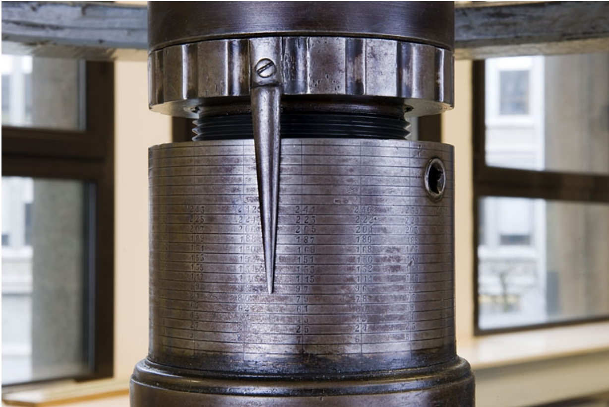
Graduations du système de réglage au dixième de mm.