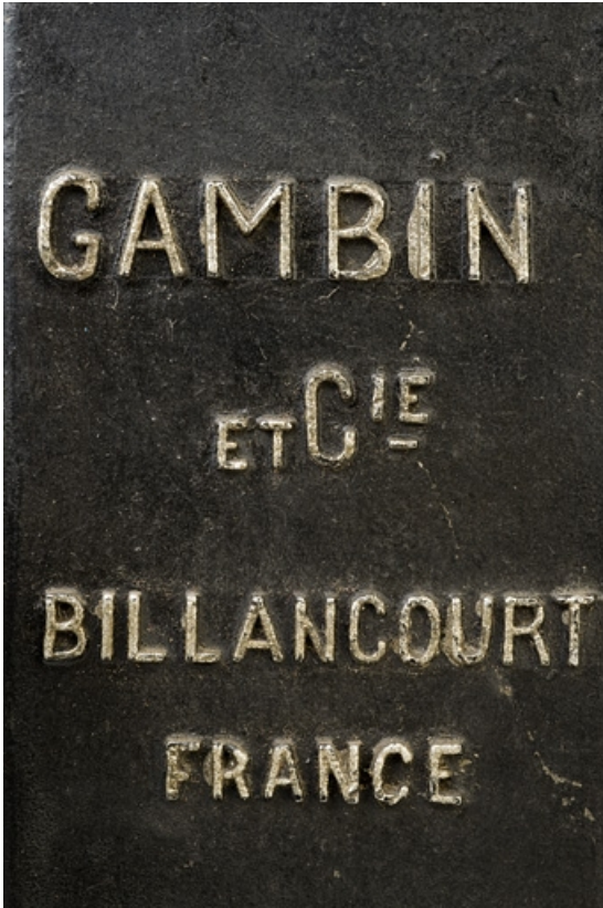
Grand jouet : inscription se rapportant au constructeur des fraiseuses.