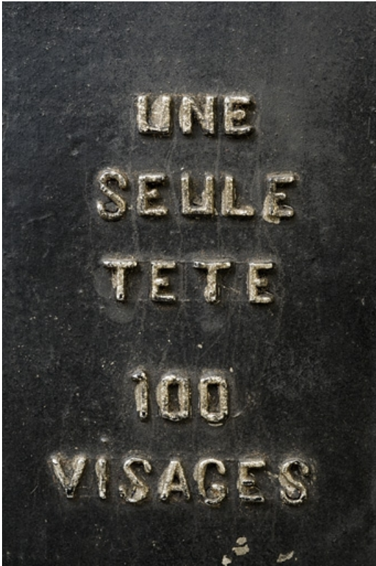
Grand jouet : devise.