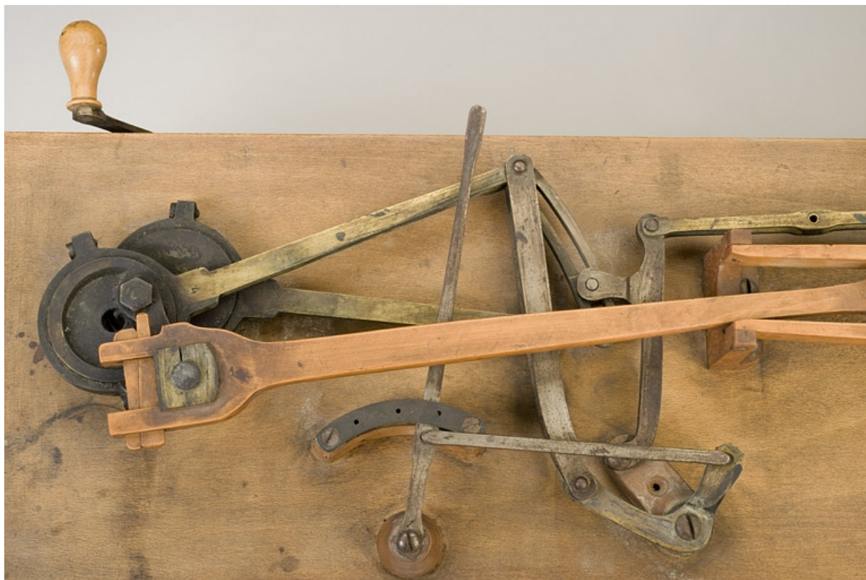
Partie gauche : coulisse et bielle.