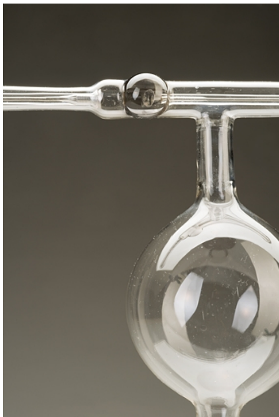
Détail : sphère et bras horizontal.