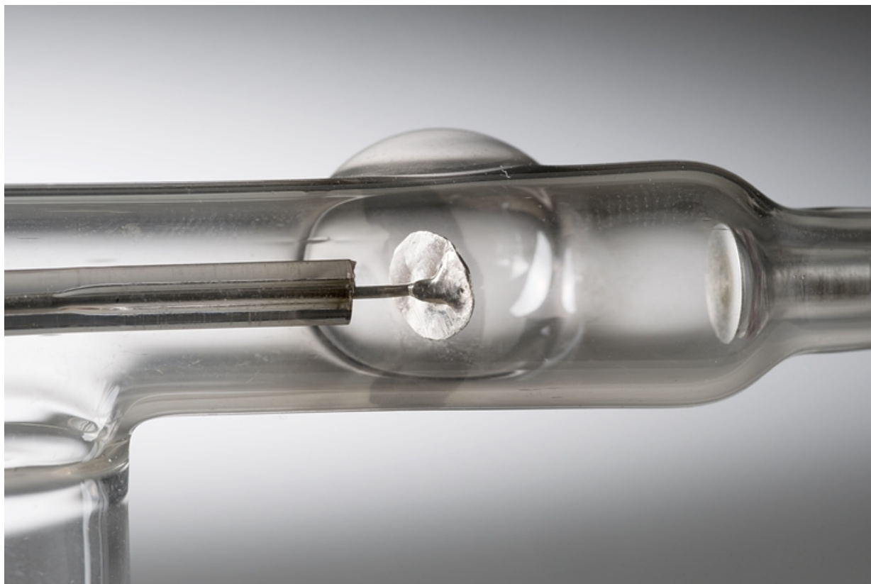
Détail : anode et cathode.