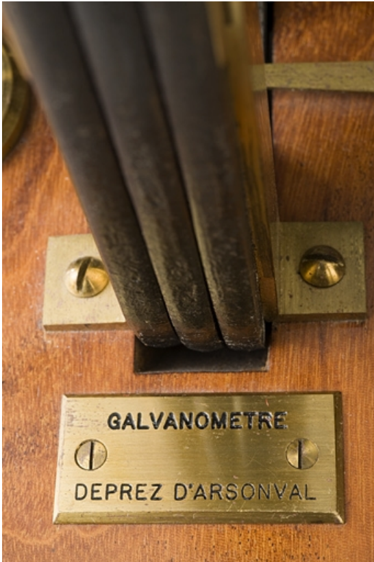
Plaque identifiant l'appareil.