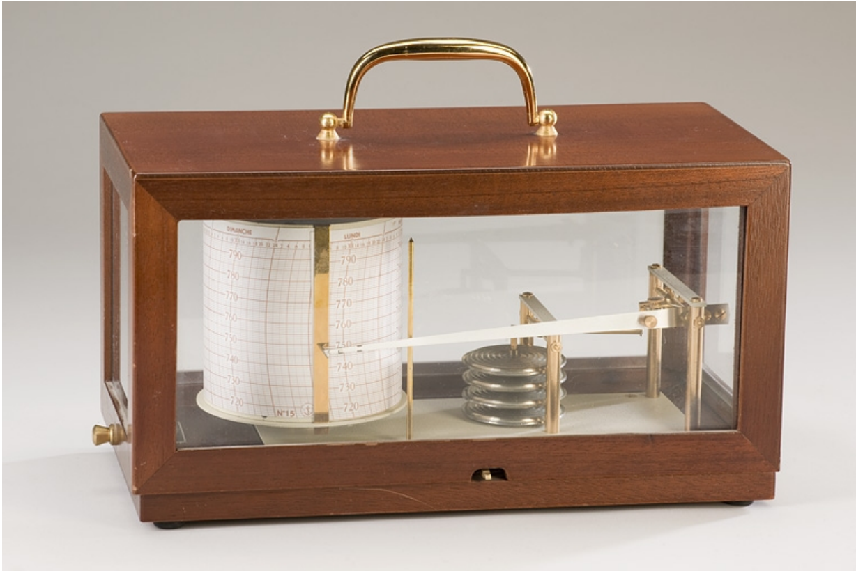
Vue d'ensemble, boîte fermée.