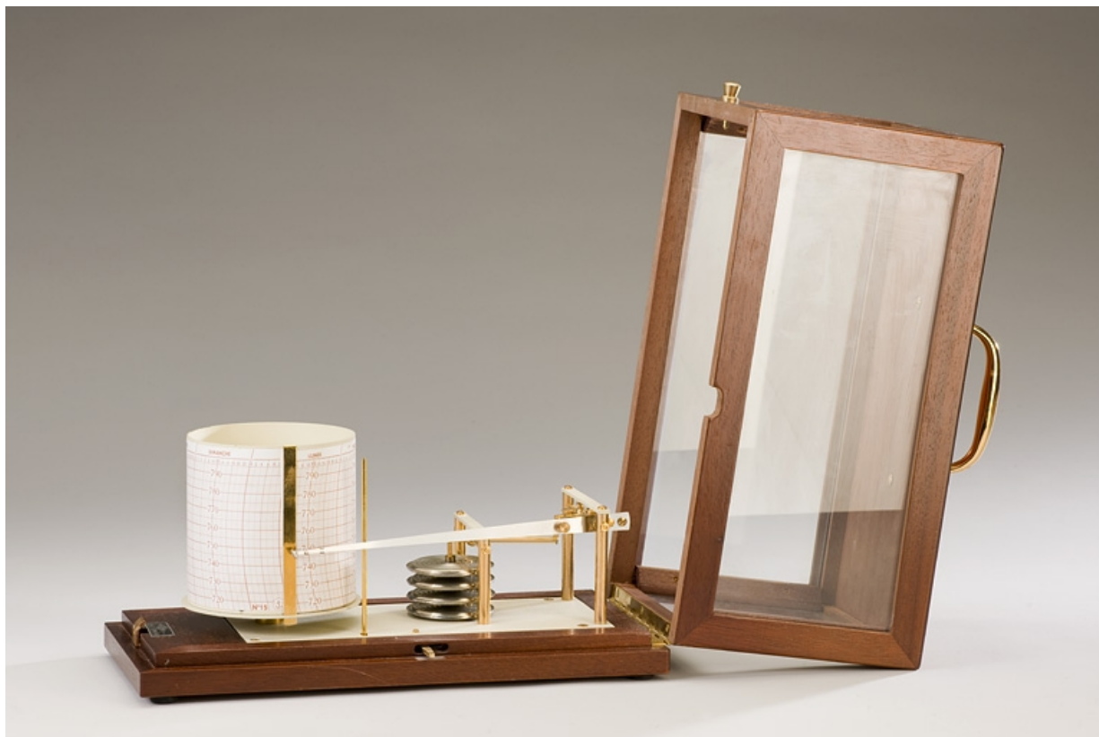
Vue d'ensemble, boîte ouverte.