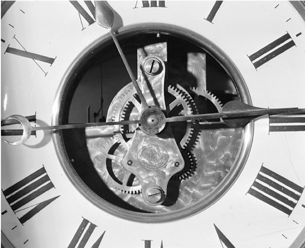
Aiguilles et logotype de l'école.