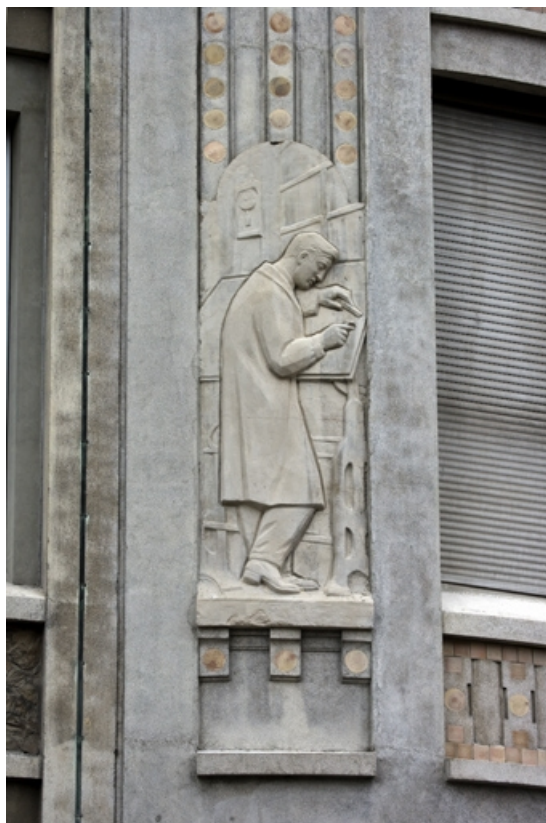
1er bas-relief : l'élève dessinant.