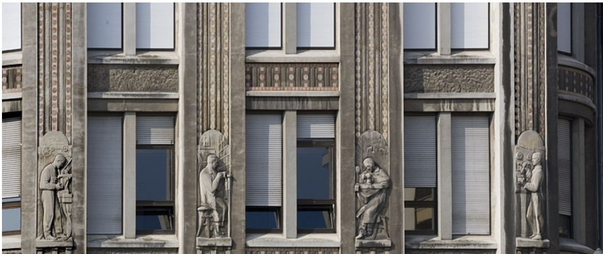
Vue d'ensemble des quatre bas-reliefs centraux.