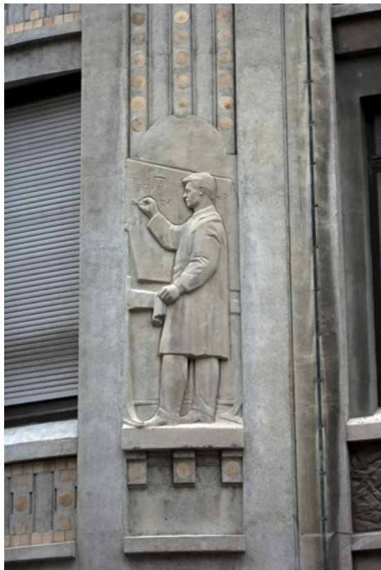
6e bas-relief : l'élève étudiant les mathématiques.