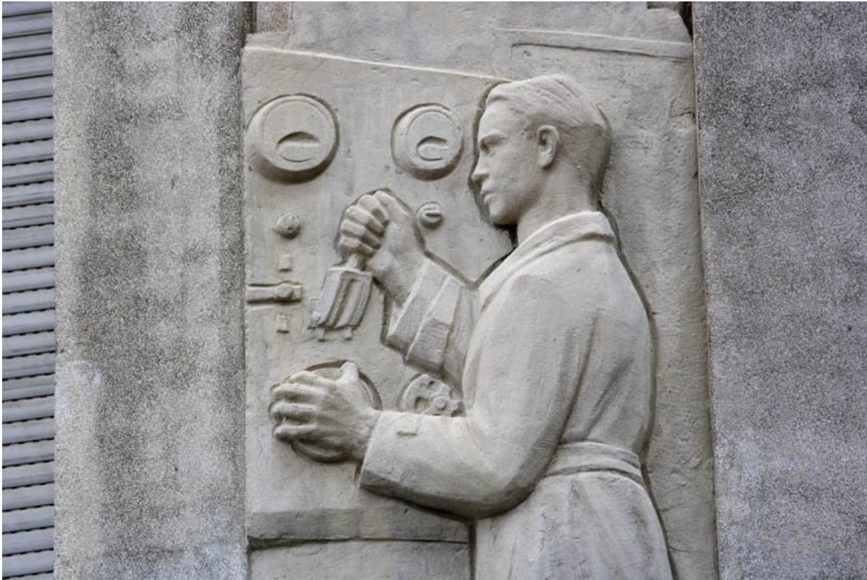
5e bas-relief : l'électricien (détail).