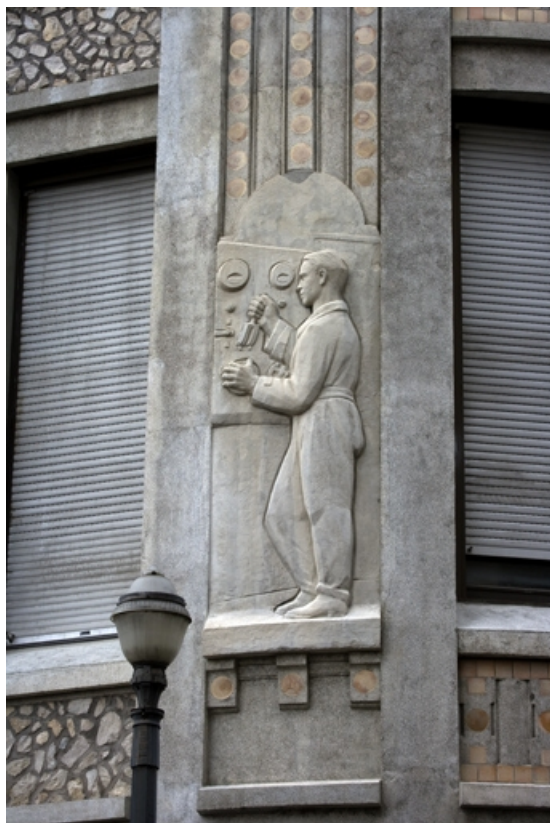
5e bas-relief : l'électricien.