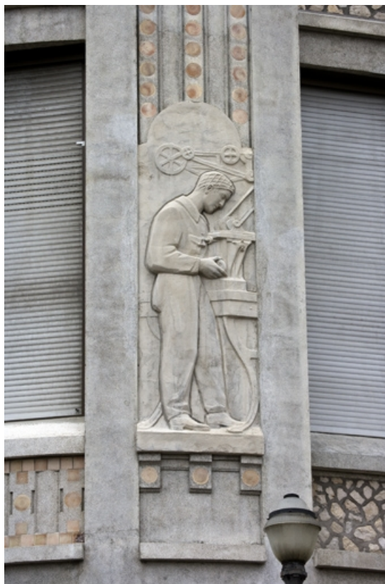
2e bas-relief : le mécanicien.