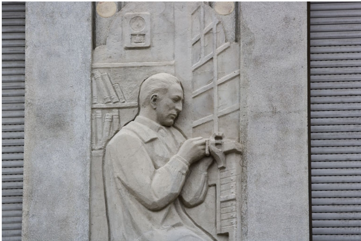
3e bas-relief : l'horloger (détail).