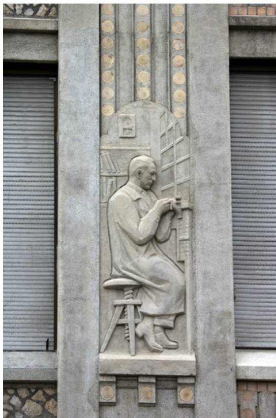
3e bas-relief : l'horloger.