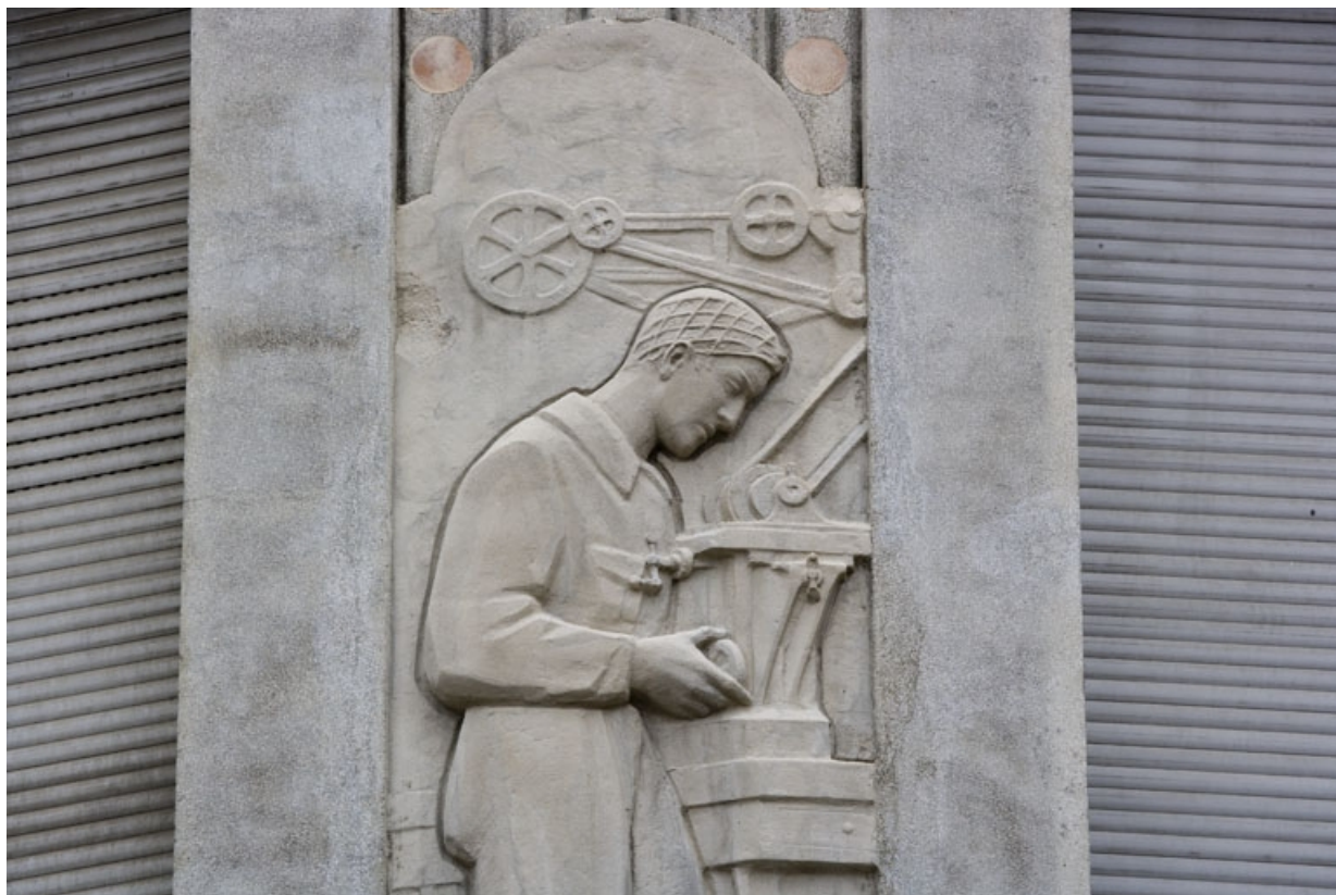
2e bas-relief : le mécanicien (détail).