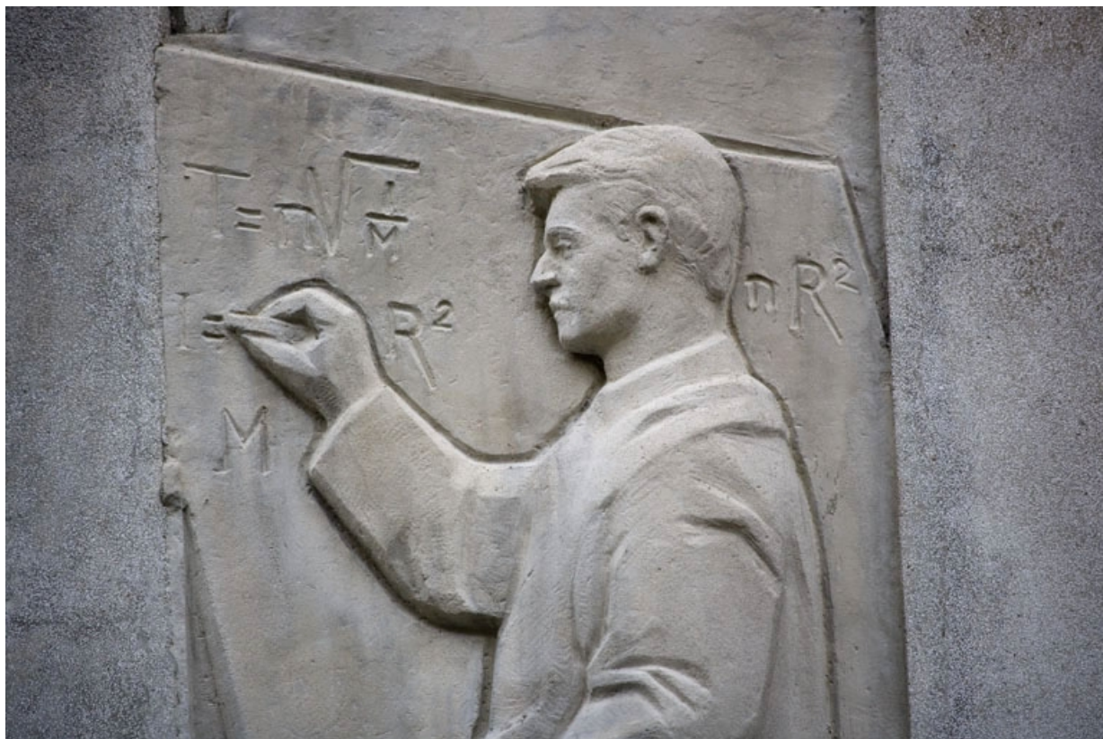
6e bas-relief : l'élève étudiant les mathématiques (détail).