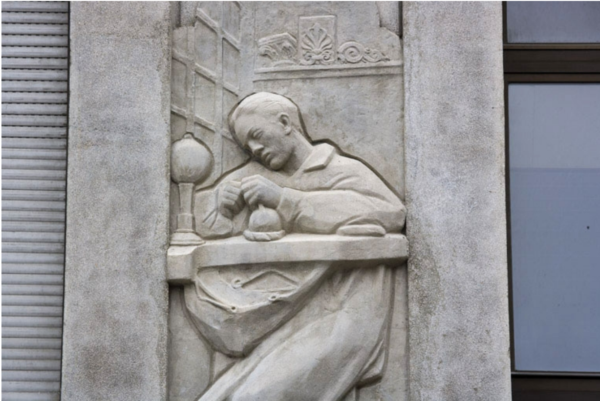
4e bas-relief : le bijoutier (détail).