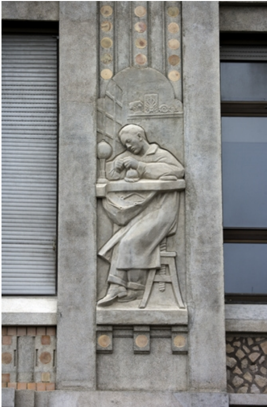
4e bas-relief : le bijoutier.