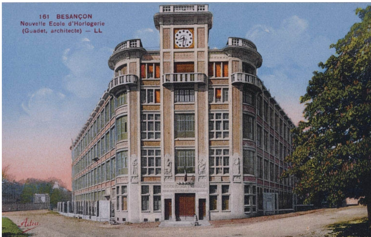
Besançon. Nouvelle Ecole d'Horlogerie (Guadet architecte), vers 1932.