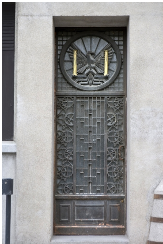
Porte latérale gauche.