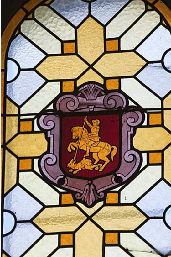
Verrière héraldique de la confrérie de saint Georges. 25, Rougemont quartier de la Citadelle