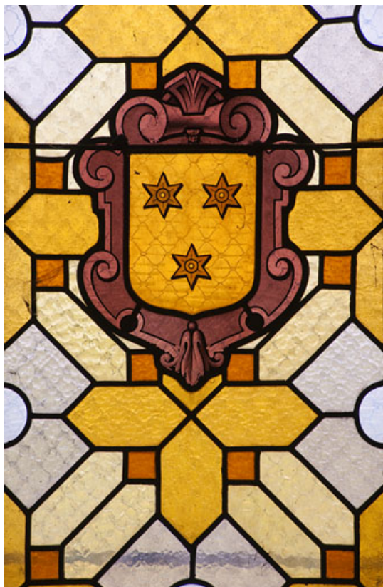
Verrière héraldique de Philibert de Molans.