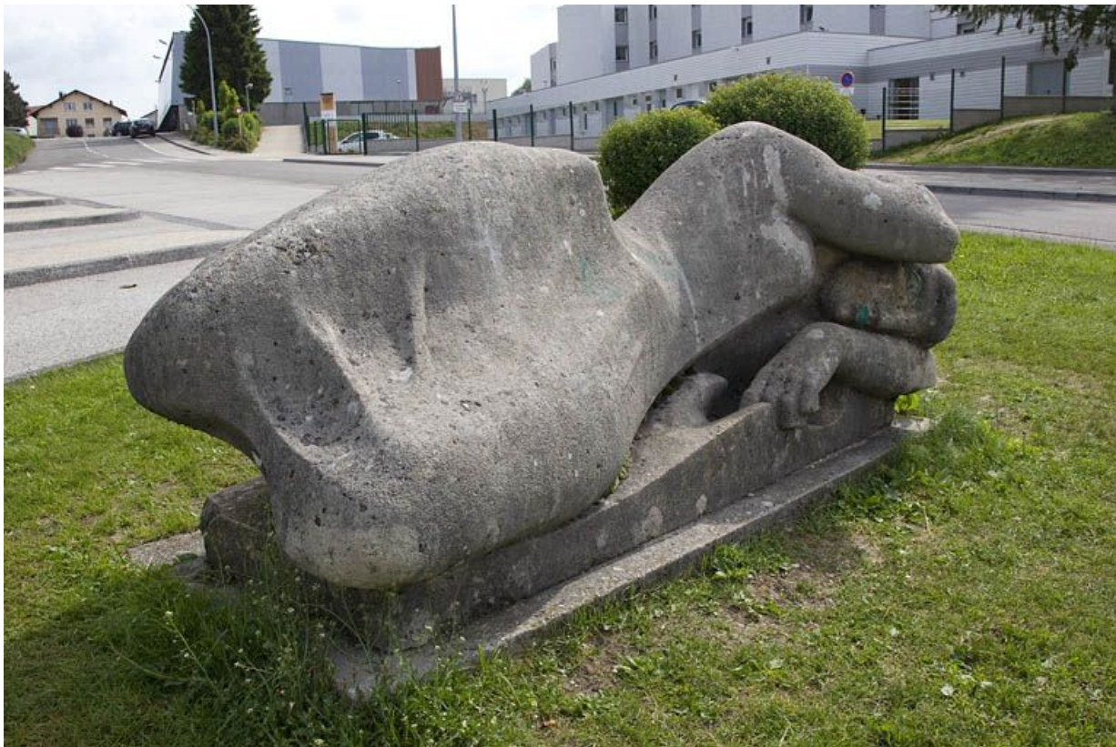
Face antérieure, de trois quarts gauche.

25, Morteau, 2 rue du Docteur Léon Sauze