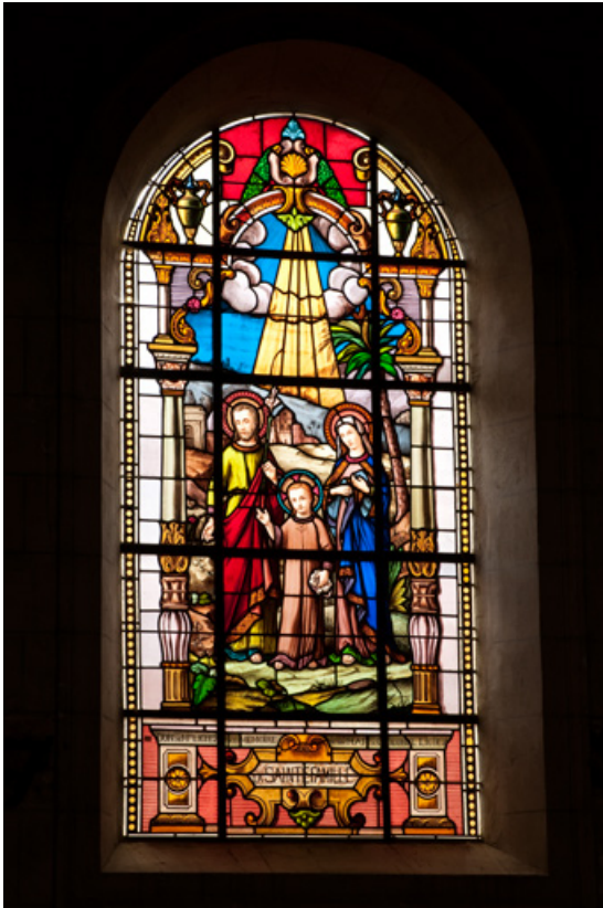
Verrière n°1 : sainte Famille. Vue générale.