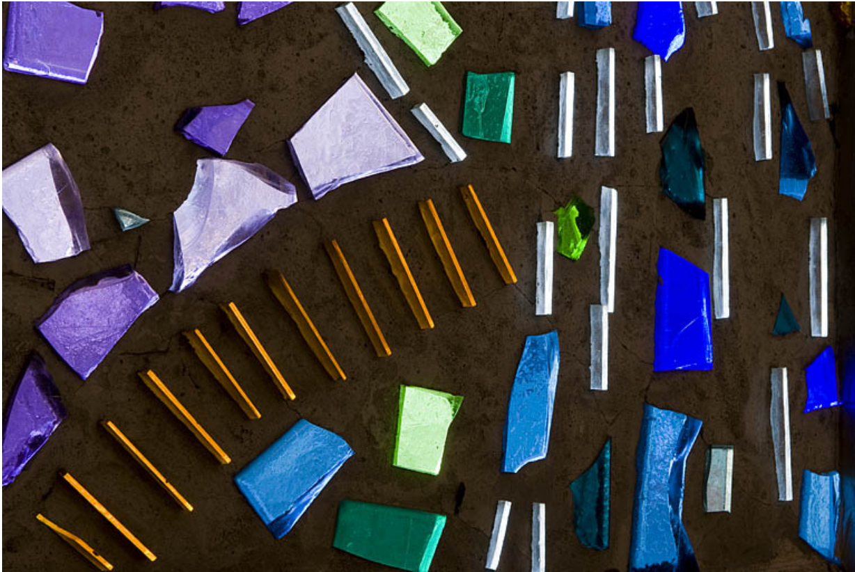
Détail du chemin menant à la croix. 25, Rougemont quartier de la Citadelle