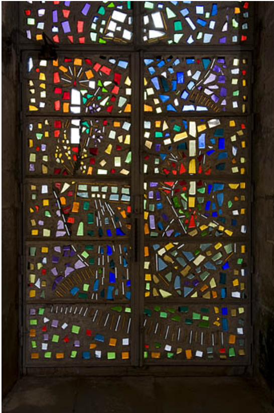
Vue générale rapprochée depuis l'intérieur.