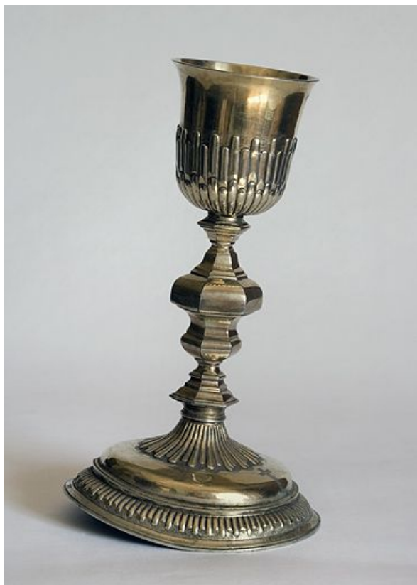
Vue générale. 25, Bonnevaux