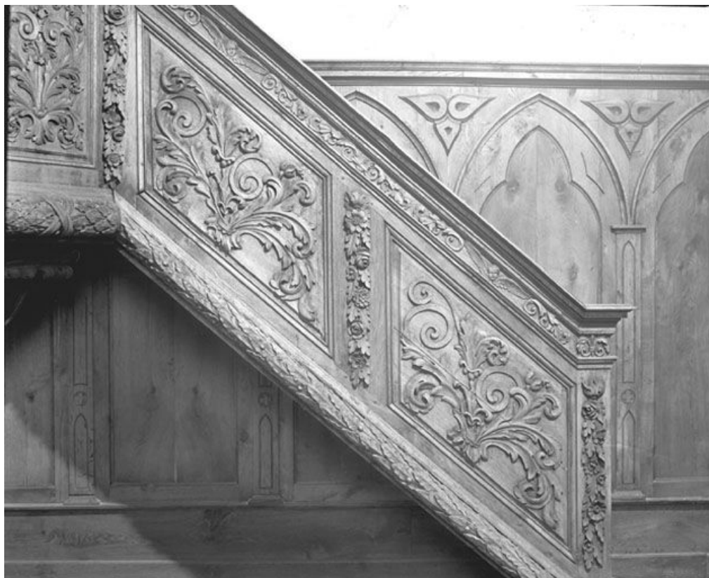
Panneaux de la rampe. 25, Rochejean