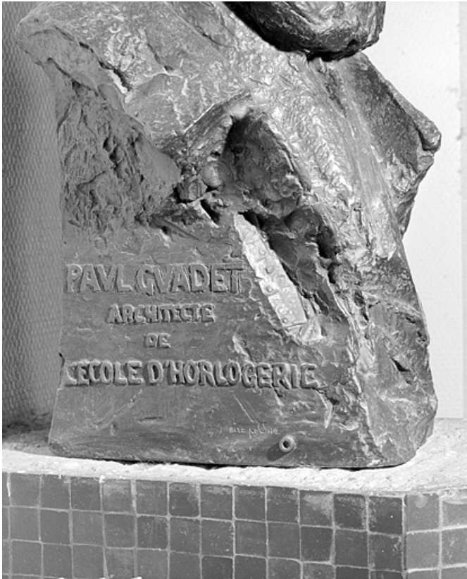
Inscription identifiant Guadet.