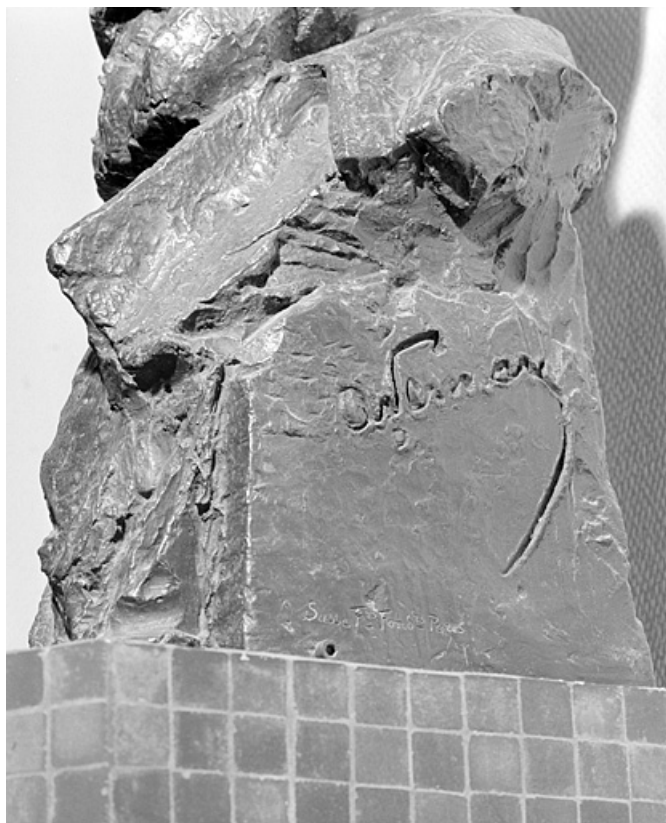
Signature de Vermare.