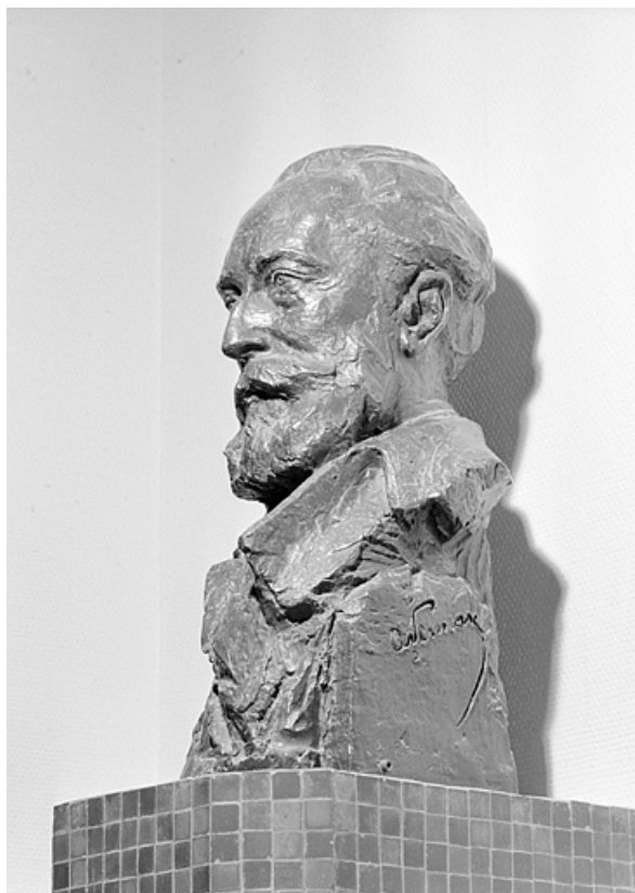
Vue d'ensemble, de trois quart droite.