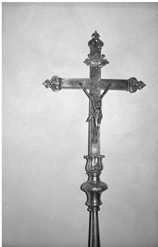
Croix de procession. 25, Verrières-de-Joux