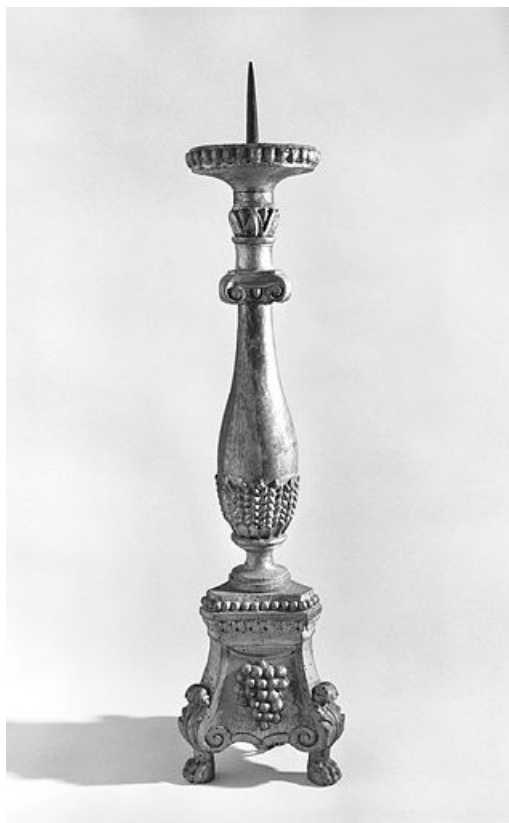
Vue d'un chandelier du maître-autel.