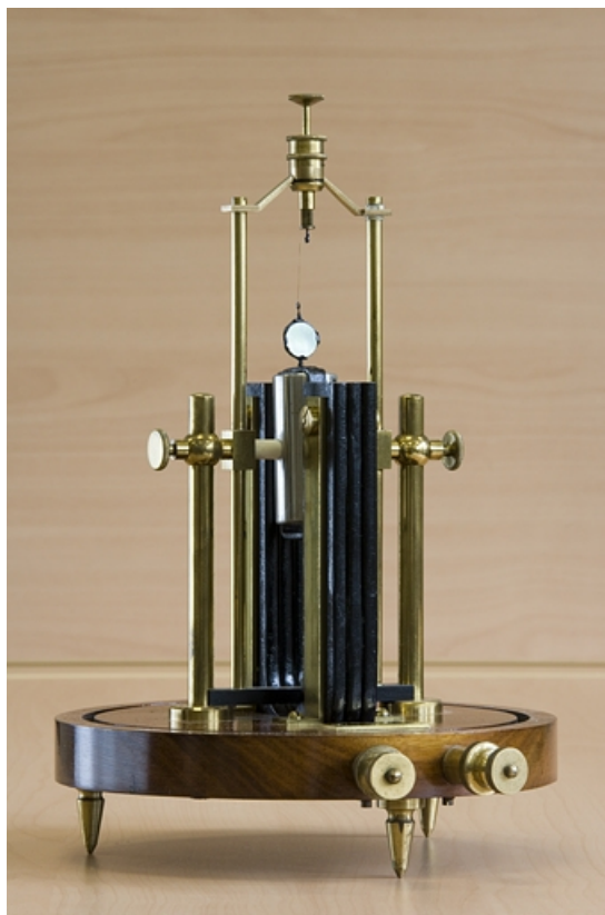
Vue d'ensemble, sans la cloche.

25, Besançon, 34, 36, 41 à 43 avenue de l' Observatoire, lieudit : la Bouloie