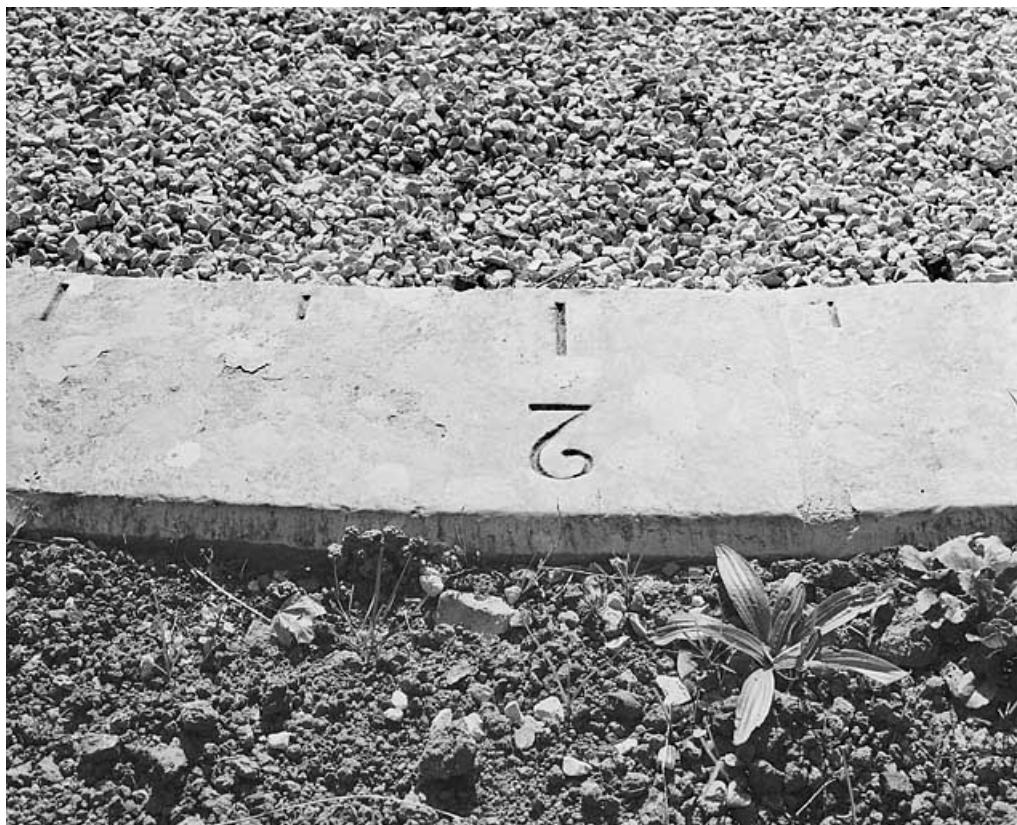
L'une des pierres de l'ellipse, avec le chiffre 2, après restauration.

25, Besançon, 34, 36, 41 à 43 avenue de l' Observatoire, lieudit : la Bouloie