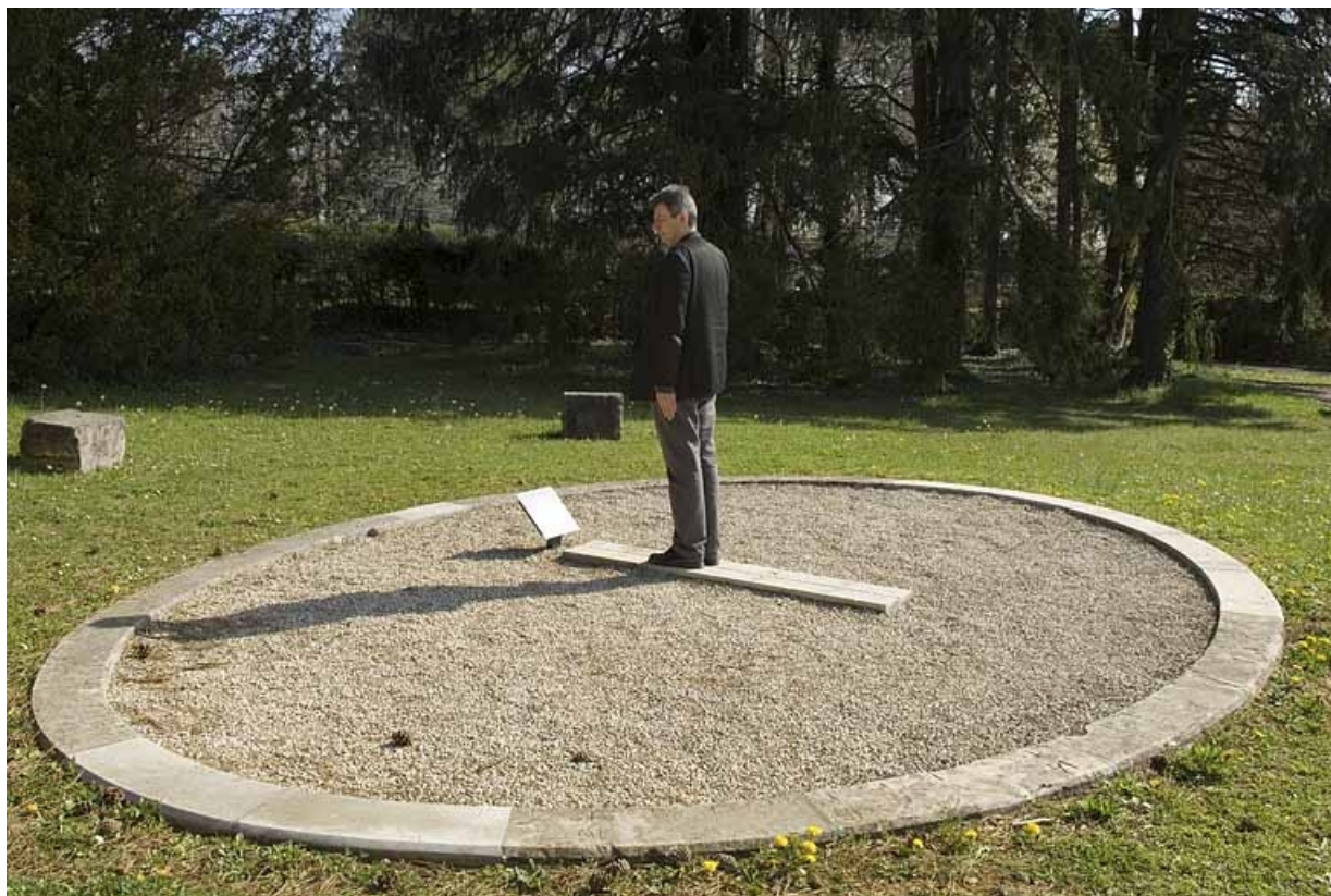
Vue d'ensemble rapprochée, après restauration. L'ombre de la personne positionnée sur le signe zodiacal correspondant à la période de l'année indique l'heure.

25, Besançon, 34, 36, 41 à 43 avenue de l' Observatoire, lieudit : la Bouloie