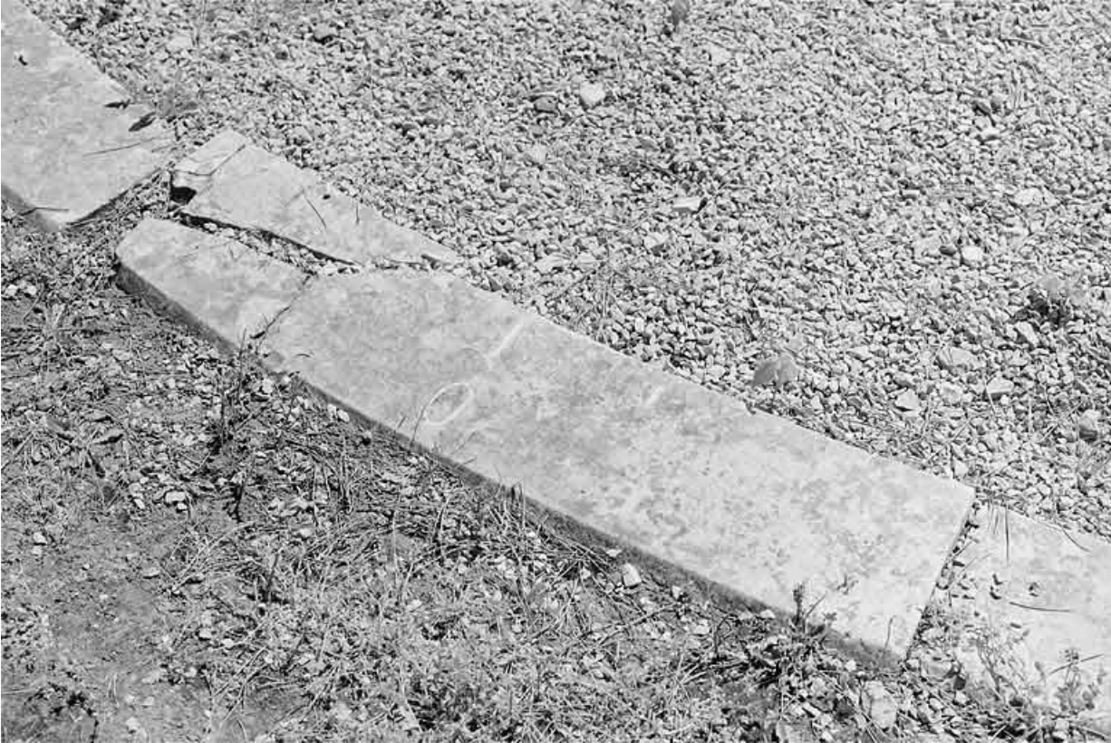
L'une des pierres de l'ellipse, avant restauration.

25, Besançon, 34, 36, 41 à 43 avenue de l' Observatoire, lieudit : la Bouloie