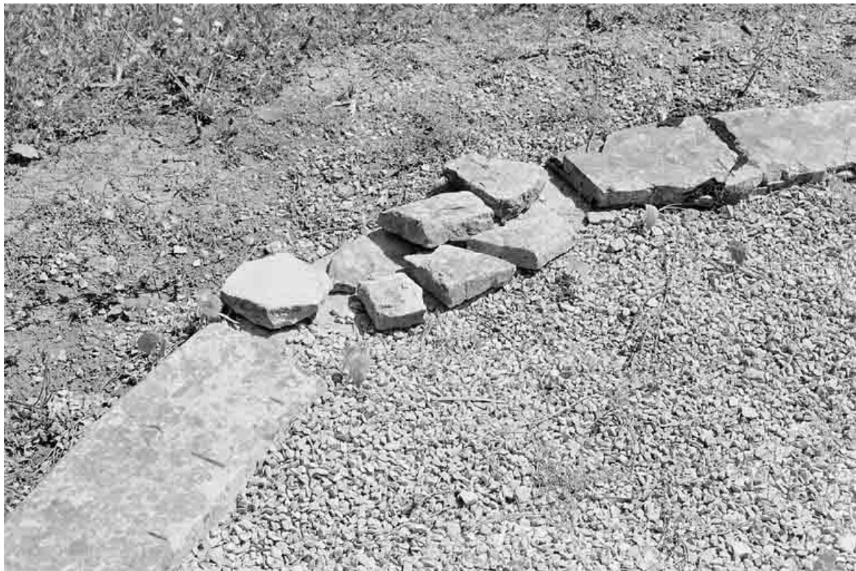
L'ellipse en pierre, avant restauration.

25, Besançon, 34, 36, 41 à 43 avenue de l' Observatoire, lieudit : la Bouloie