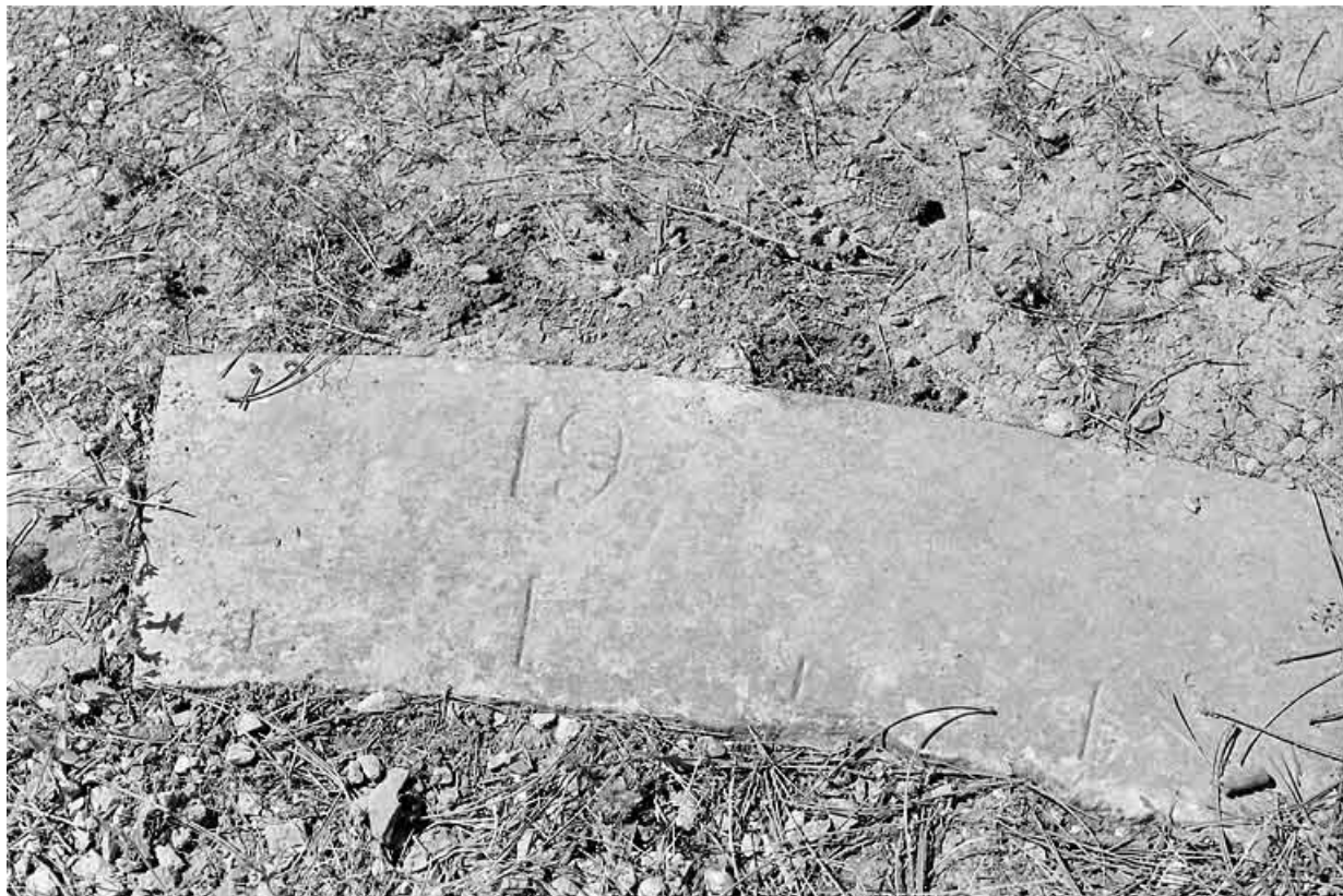
L'une des pierres de l'ellipse, avec le chiffre 19, avant restauration.

25, Besançon, 34, 36, 41 à 43 avenue de l' Observatoire, lieudit : la Bouloie