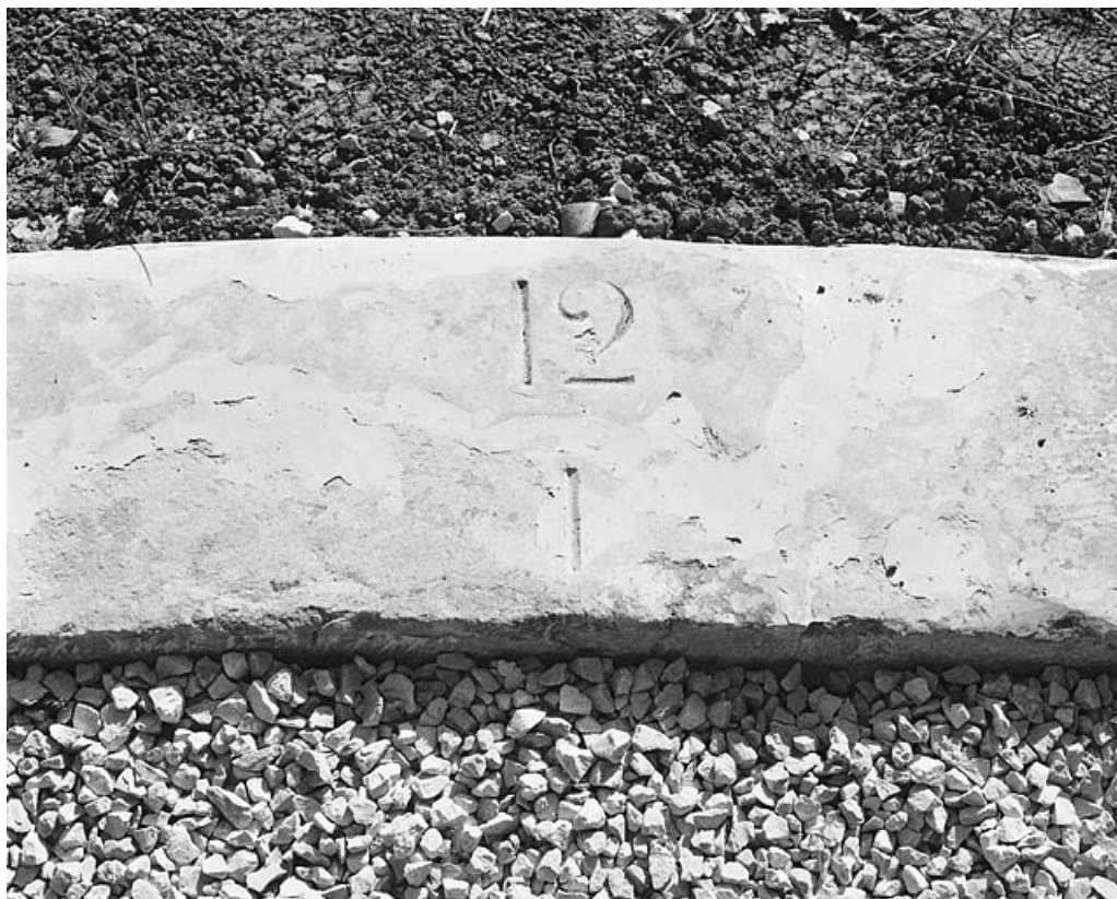
L'une des pierres de l'ellipse, avec le chiffre 12, après restauration.

25, Besançon, 34, 36, 41 à 43 avenue de l' Observatoire, lieudit : la Bouloie