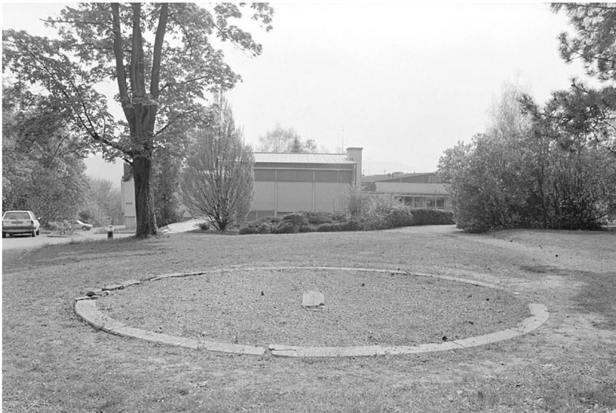
Vue d'ensemble, avant restauration.

25, Besançon, 34, 36, 41 à 43 avenue de l' Observatoire, lieudit : la Bouloie