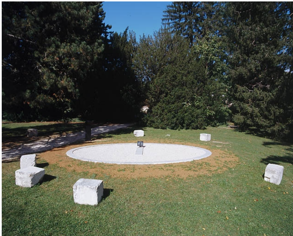
Vue d'ensemble, après restauration.

25, Besançon, 34, 36, 41 à 43 avenue de l' Observatoire, lieudit : la Bouloie