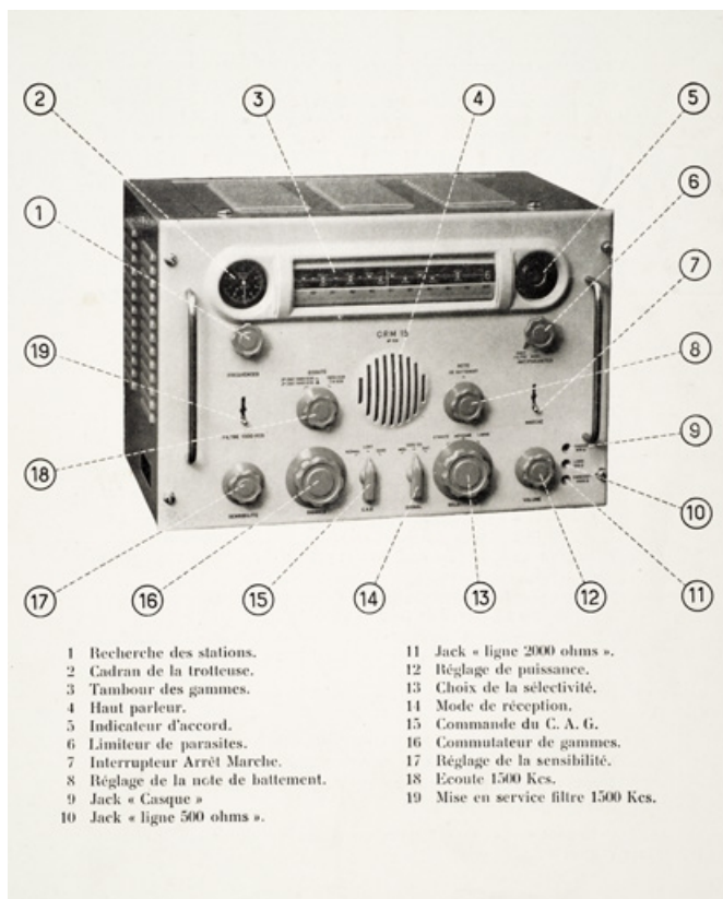
[Identification des éléments en façade], décennie 1950.

25, Besançon, 34, 36, 41 à 43 avenue de l' Observatoire, lieudit : la Bouloie