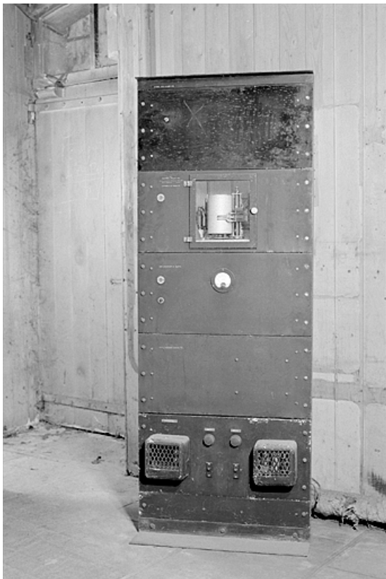
Diapason étalon : face avant.

25, Besançon, 34, 36, 41 à 43 avenue de l' Observatoire, lieudit : la Bouloie