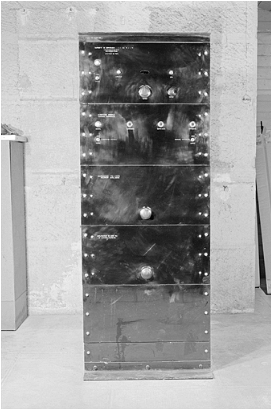
Dispositif de comparaison : face avant.

25, Besançon, 34, 36, 41 à 43 avenue de l' Observatoire, lieudit : la Bouloie