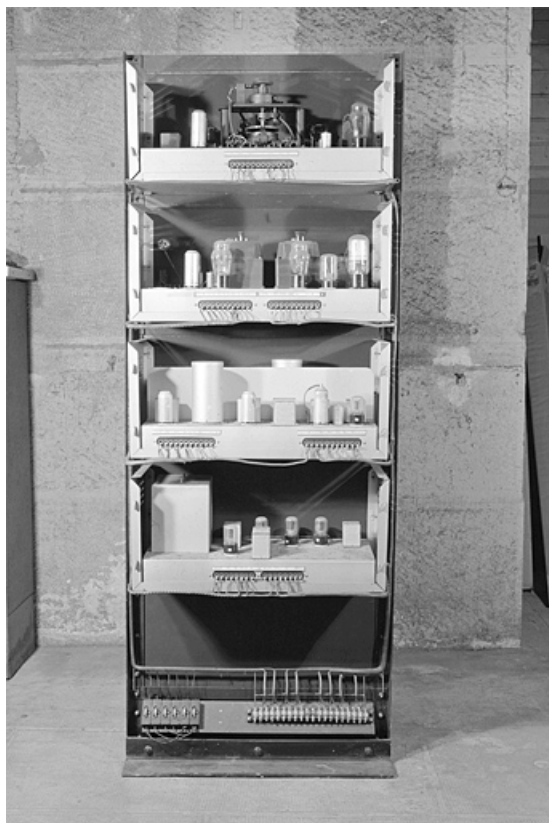
Dispositif de comparaison : face arrière, caches ôtés.

25, Besançon, 34, 36, 41 à 43 avenue de l' Observatoire, lieudit : la Bouloie