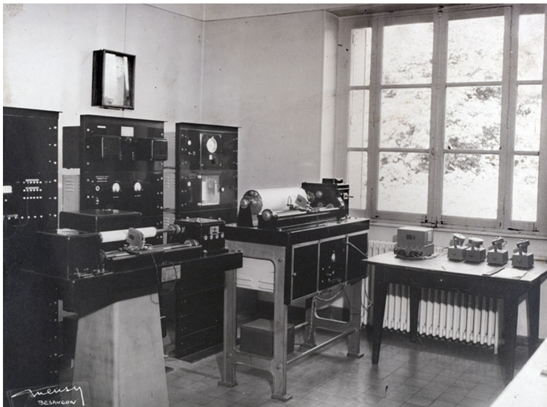
[Vue des chronographes Belin (au premier plan) et du diapason étalon (au fond à droite)], après 1940.

25, Besançon, 34, 36, 41 à 43 avenue de l' Observatoire, lieudit : la Bouloie