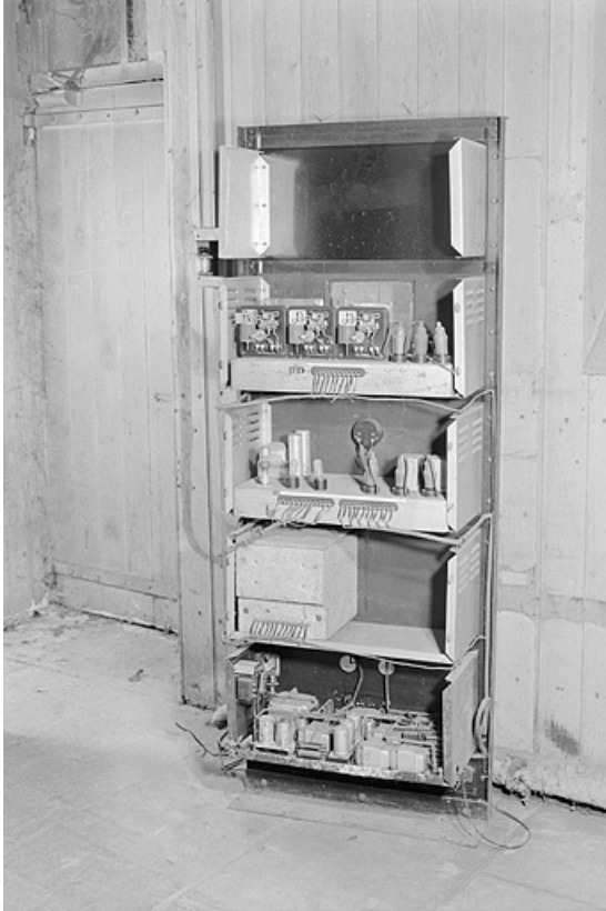
Diapason étalon : face arrière.

25, Besançon, 34, 36, 41 à 43 avenue de l' Observatoire, lieudit : la Bouloie