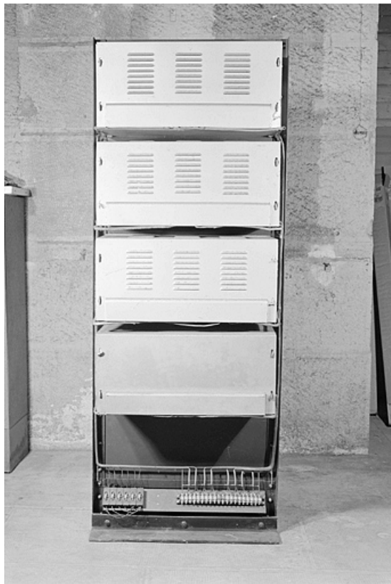
Dispositif de comparaison : face arrière, caches en place.

25, Besançon, 34, 36, 41 à 43 avenue de l' Observatoire, lieudit : la Bouloie