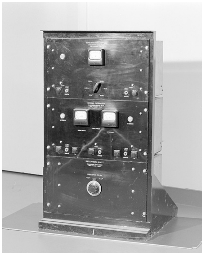
Horloge du Musée du Temps : vue d'ensemble.

25, Besançon, 34, 36, 41 à 43 avenue de l' Observatoire, lieudit : la Bouloie