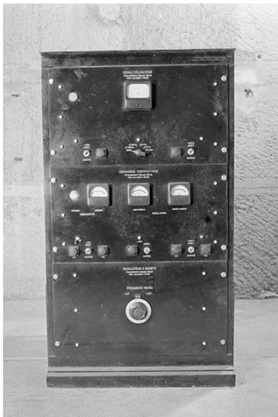
Horloge de l'Observatoire : vue d'ensemble.

25, Besançon, 34, 36, 41 à 43 avenue de l' Observatoire, lieudit : la Bouloie